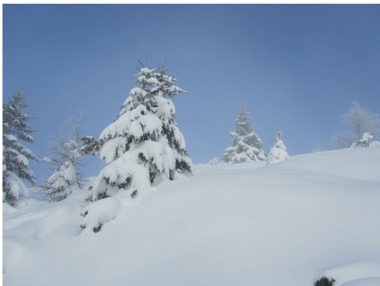
quasi in cresta