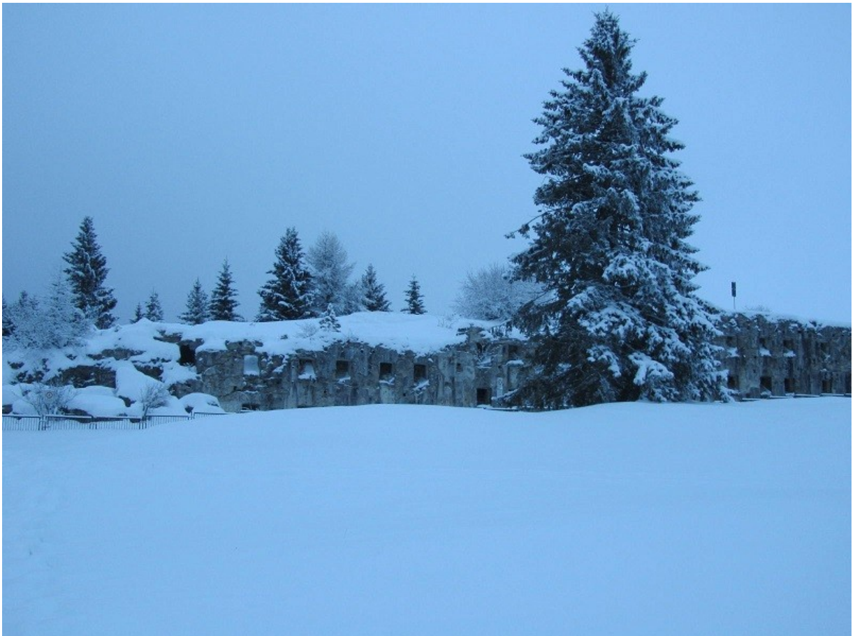
forte busa verle