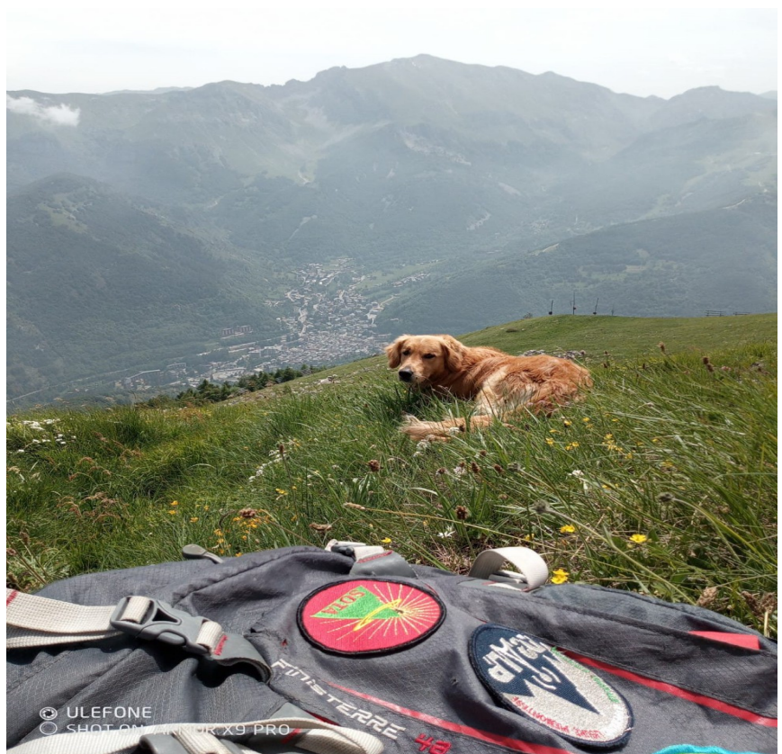
Monte Fascia sullo sfondo e Limone Piemonte