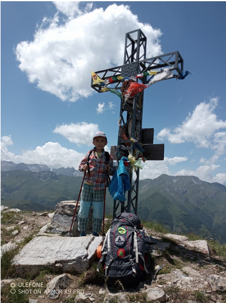
Sullo sfondo le Alpi Marittime e altre cime SOTA che attendono....