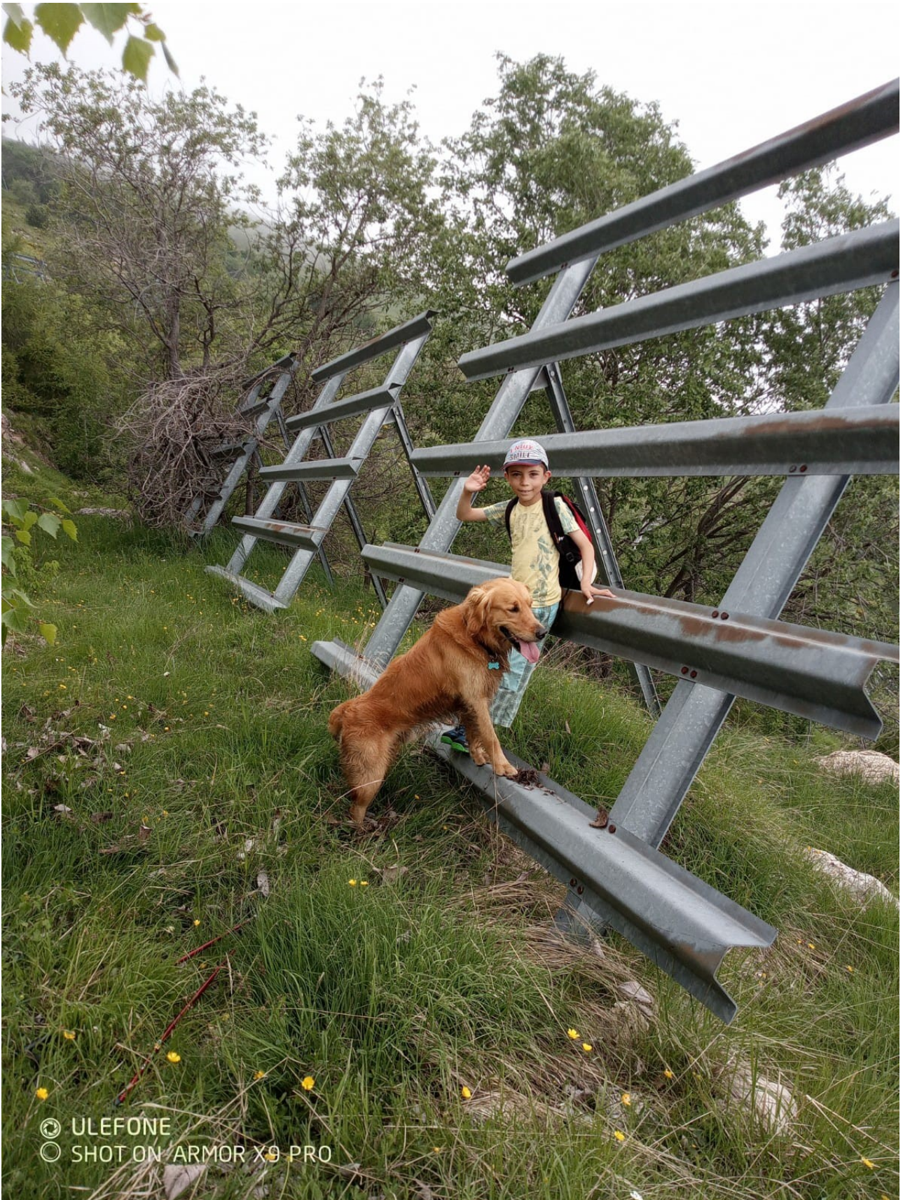
paravalanghe su percorso di salita