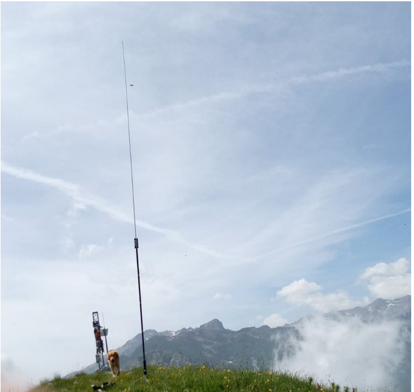
antenna in vetta