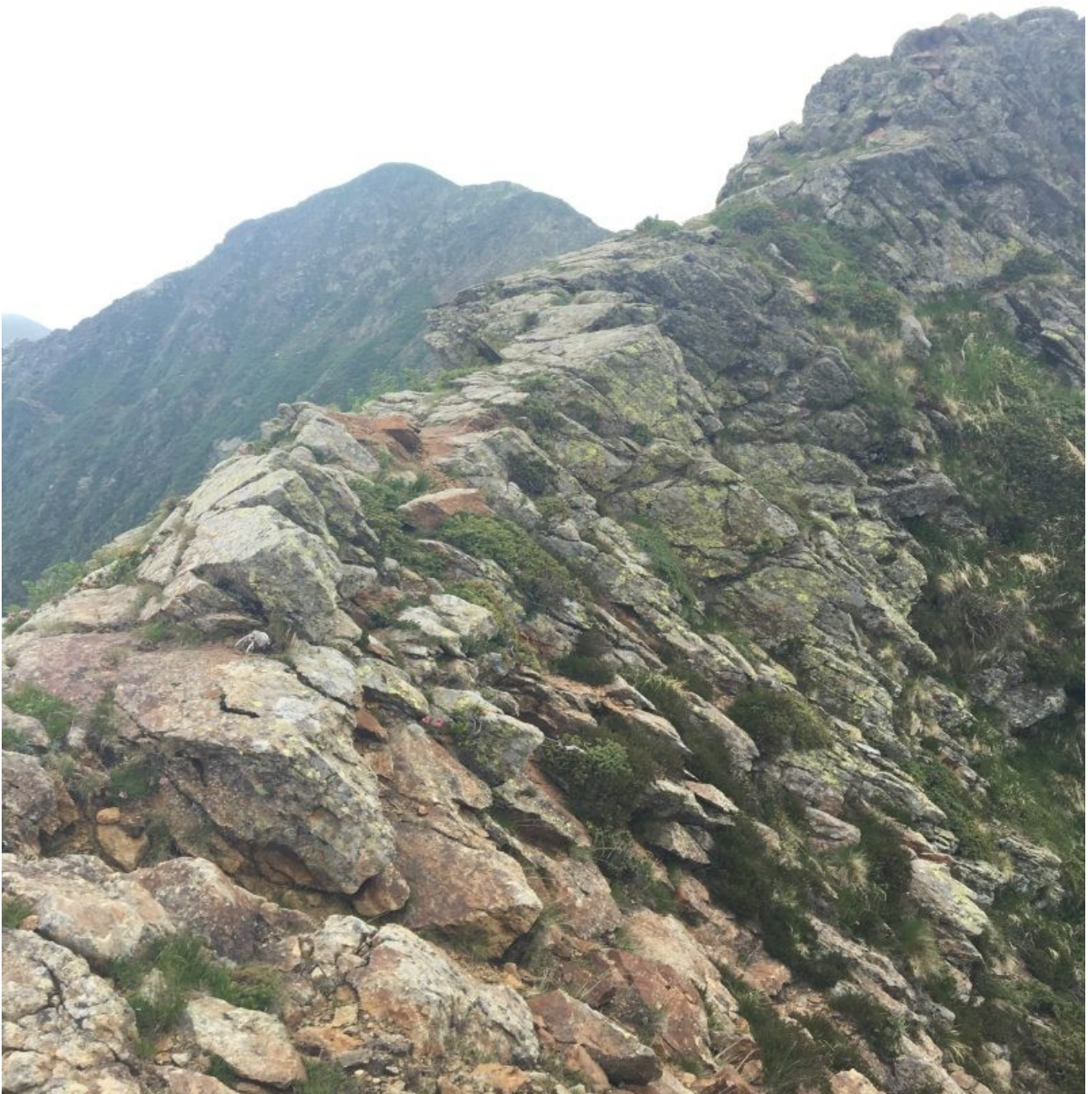
tracce di cresta