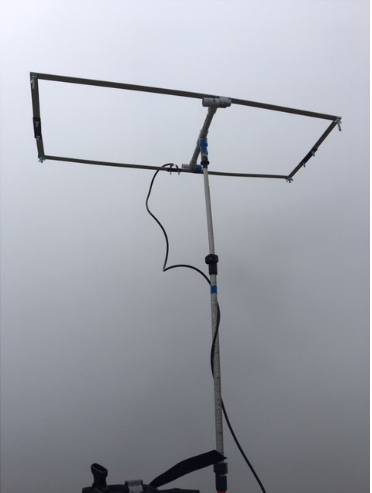
set up con panorama (?!?)