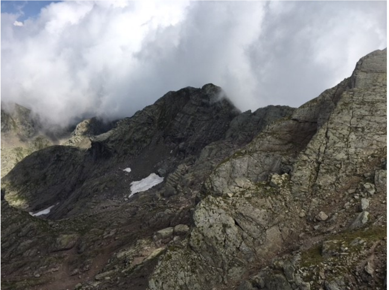
nuvole di condensa