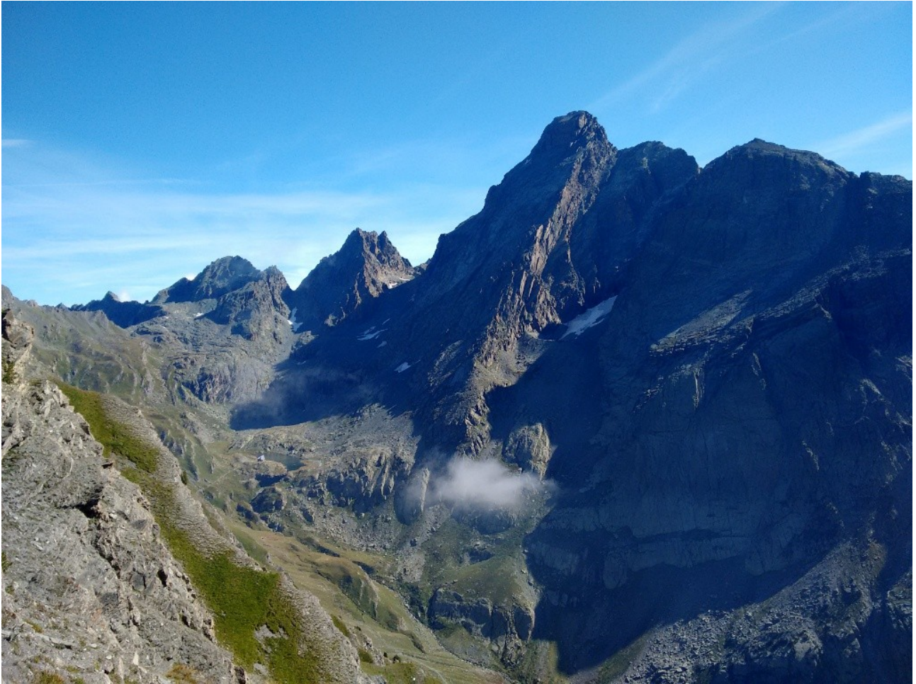
salendo vista sul monviso