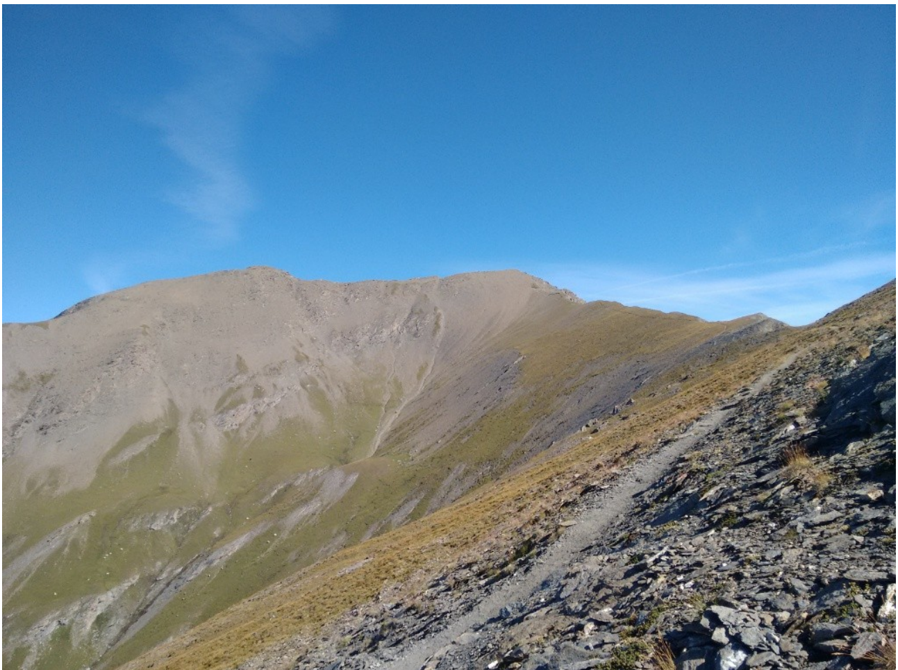
Cresta che conduce in cima

RIG: FT-817 (5 W), 2 el Moxon, Batteria LiPO 4S 3300 mAh.