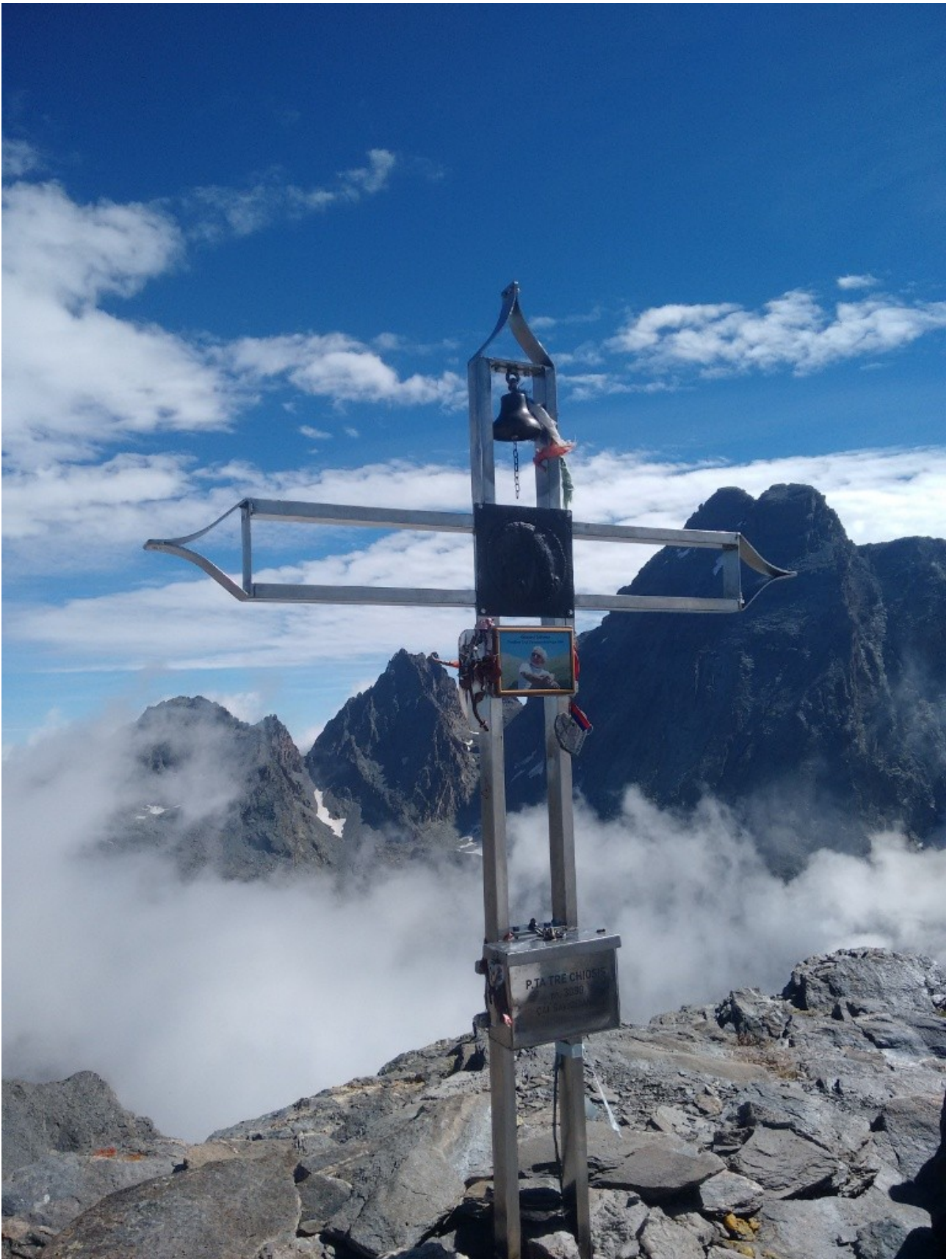
croce di vetta