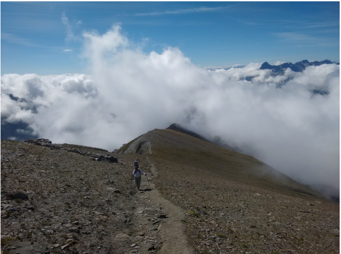
salendo oltre la coltre di nubi