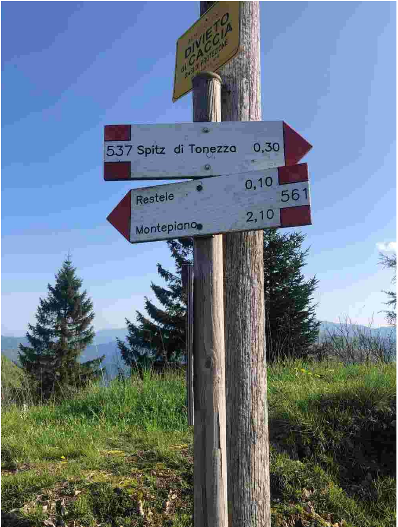
indicazione di percorso