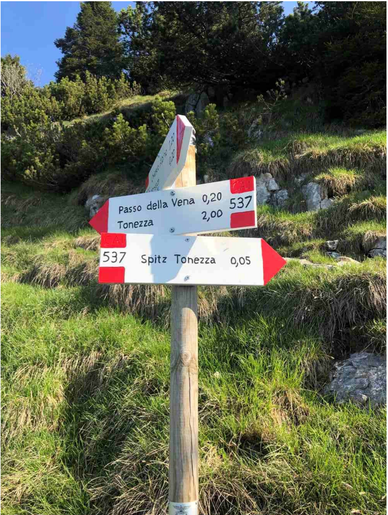
quasi in vetta