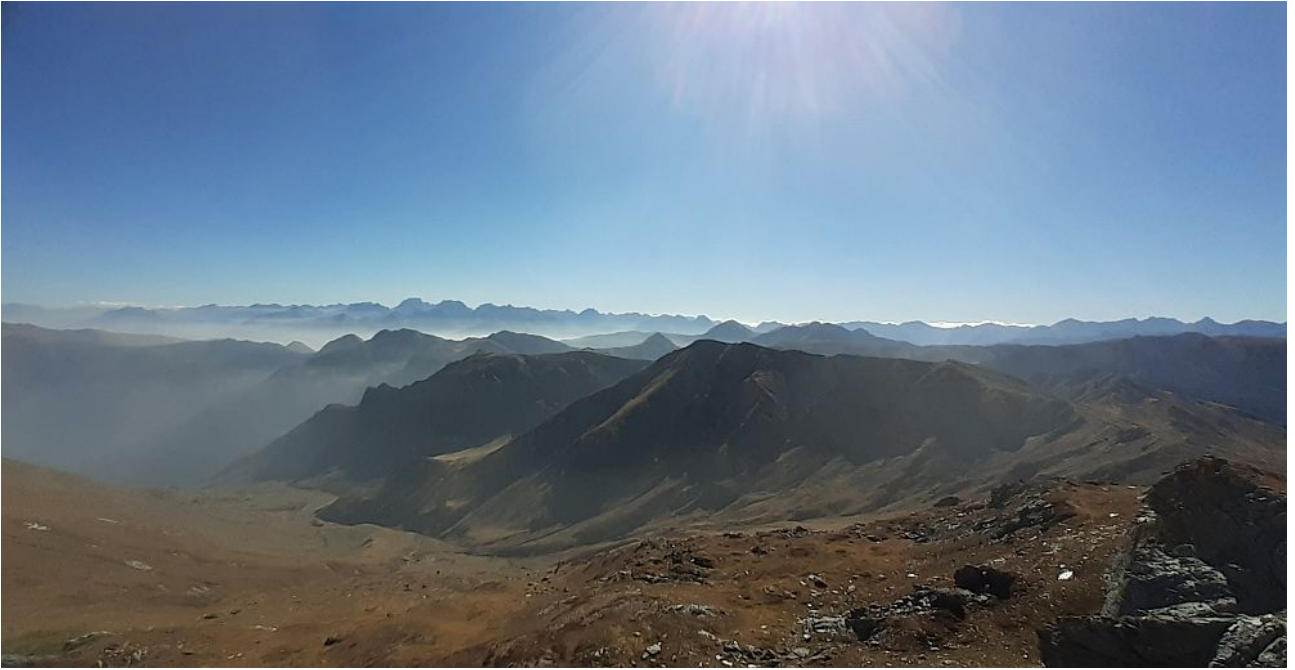
panorama a est