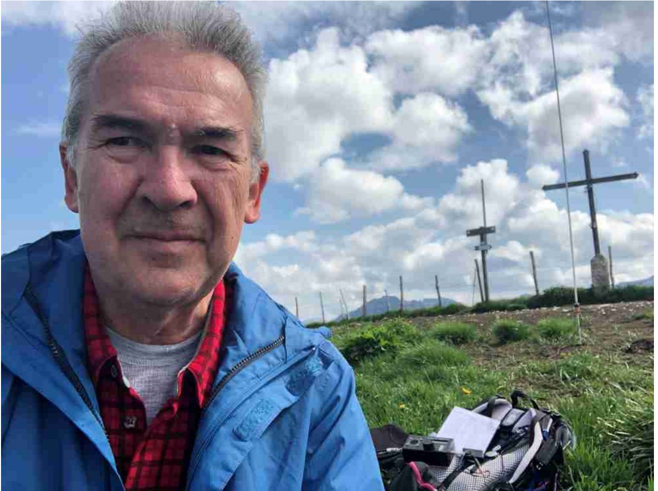
set up con attivatore