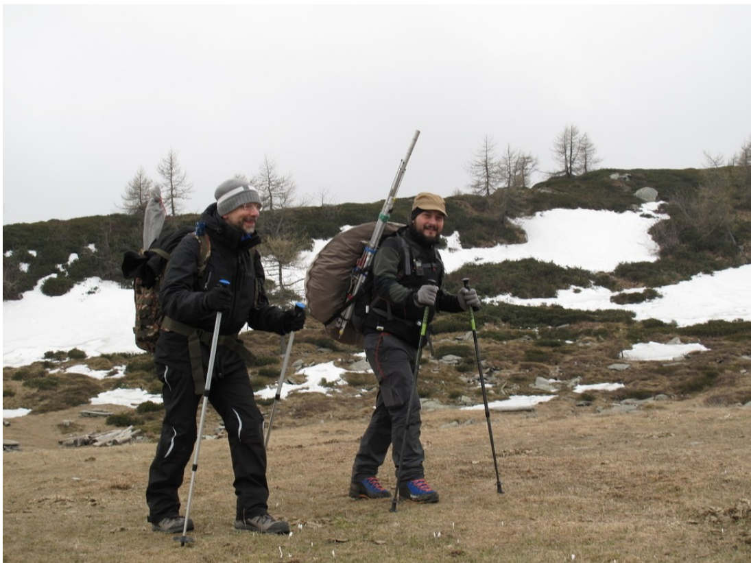
i due compari