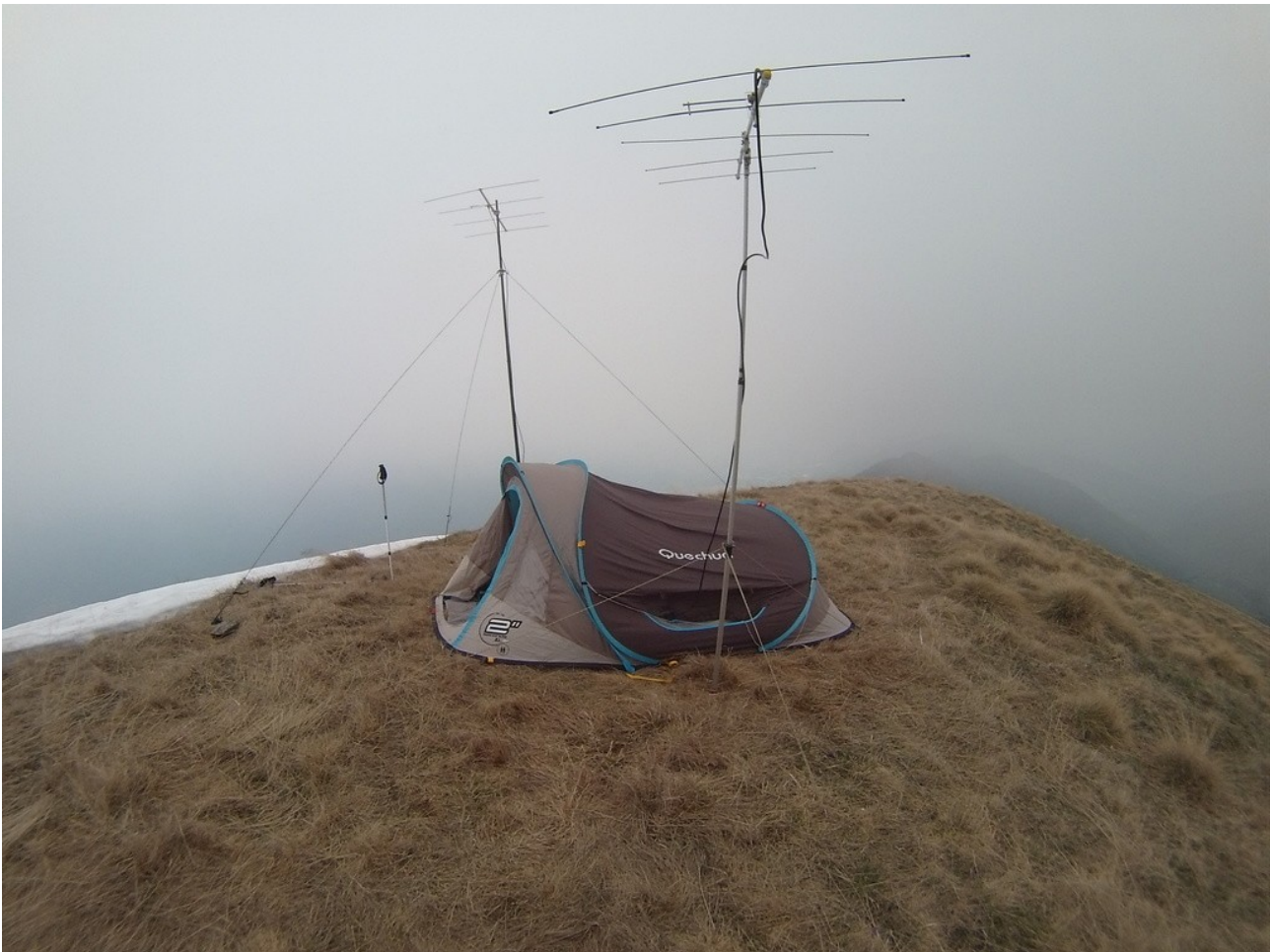
antenne con riparo