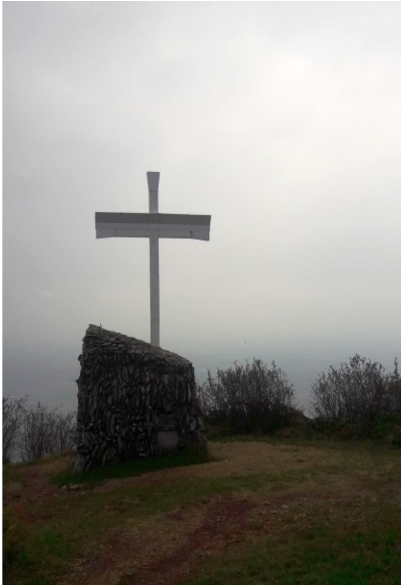
Finalmente un po' di sole.