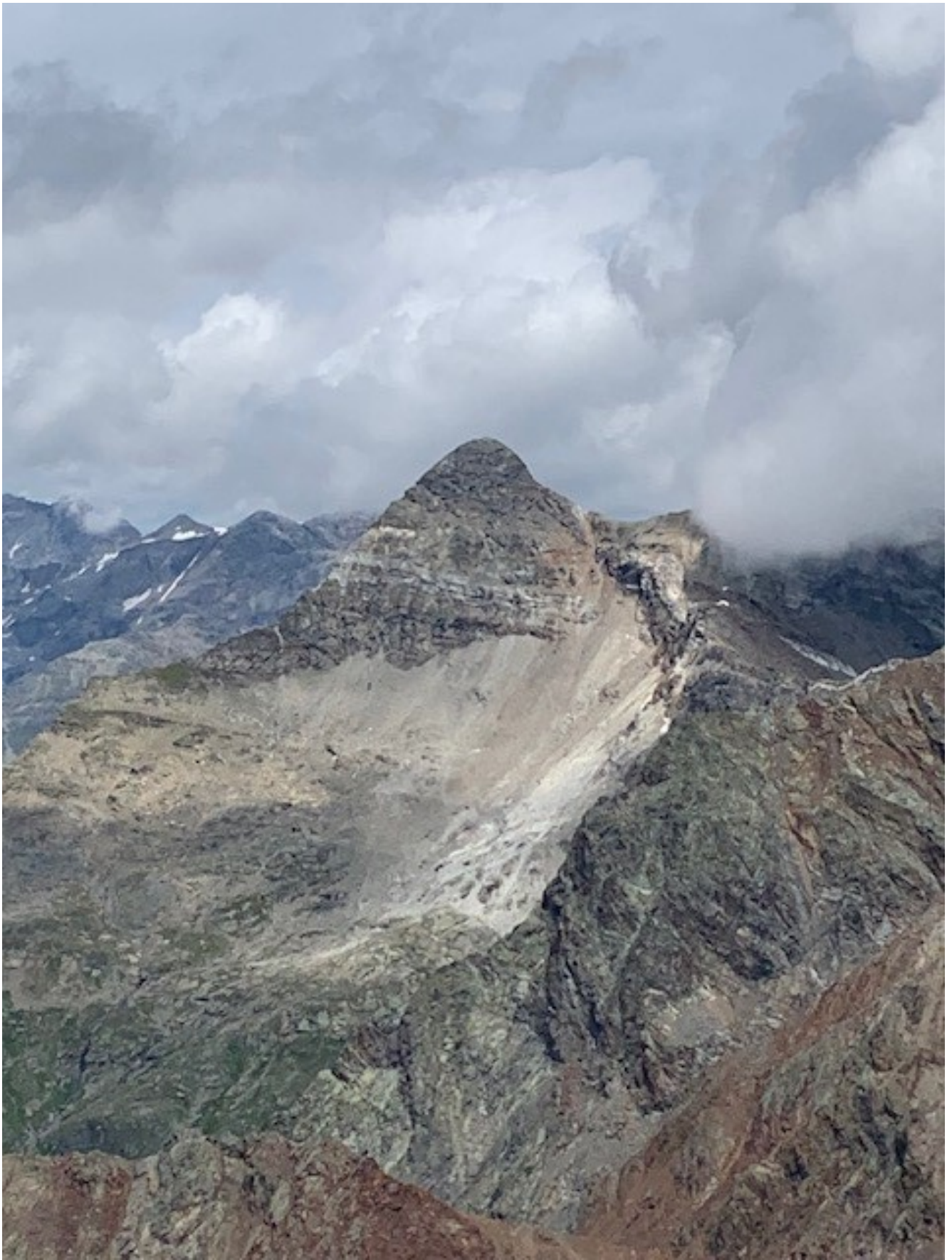
il pizzo scalino