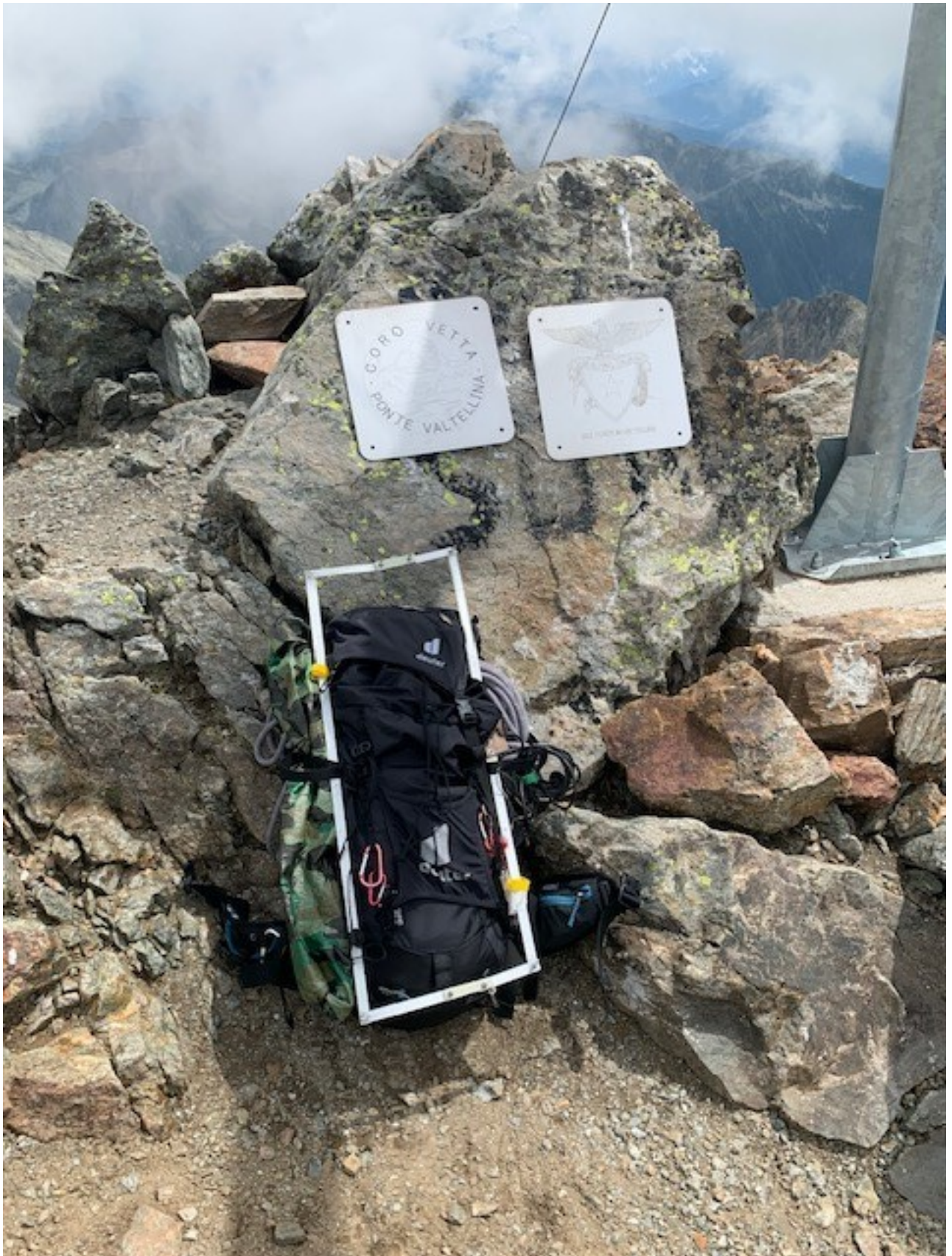
targhe in vetta