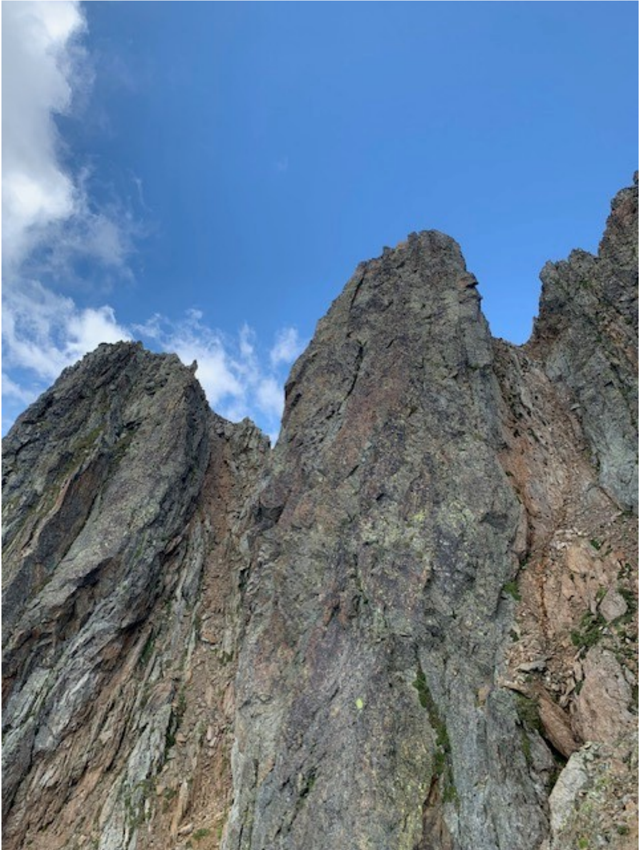
vista su corna brutana