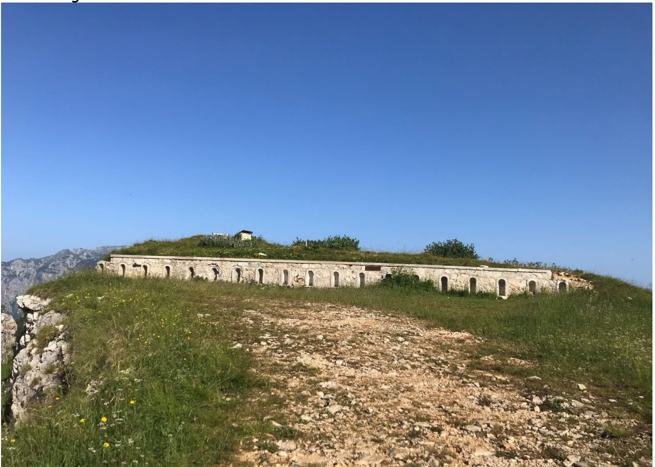
il forte sulla vetta