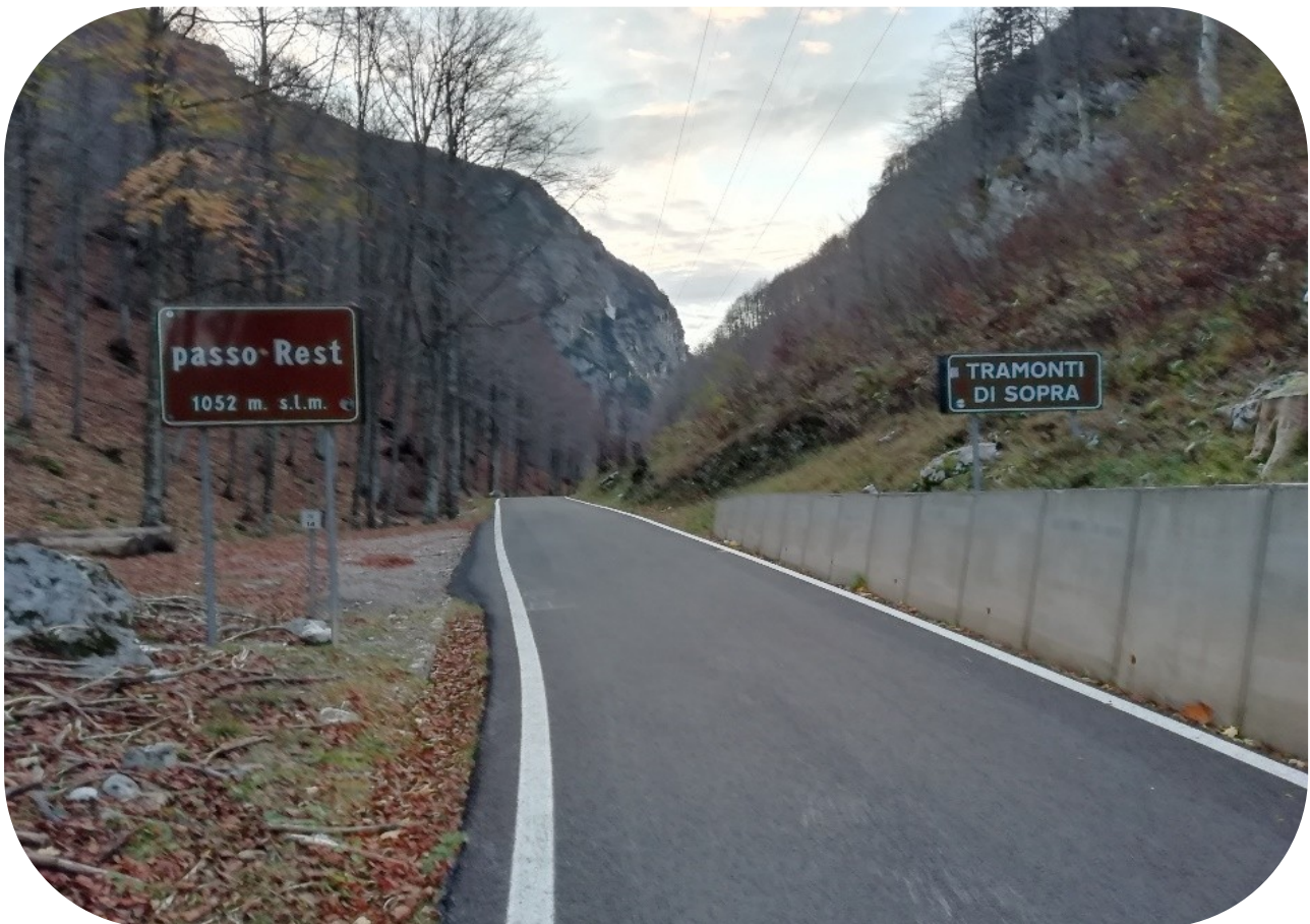
Arrivo al passo Rest

Al passo Rest (MT 1045) ci si arriva con l'auto, lo si può raggiungere, o dalla val Tramontina (Pn), o da Priuso Socchieve (Ud). Giunti al passo si lascia il veicolo nel parcheggio e si prosegue a piedi fino alla casera Monte Rest (CAI 826). Dalla casera Rest si prosegue seguendo sempre il segnavia CAI 826. Tempo impiegato per la cima due ore e trenta circa