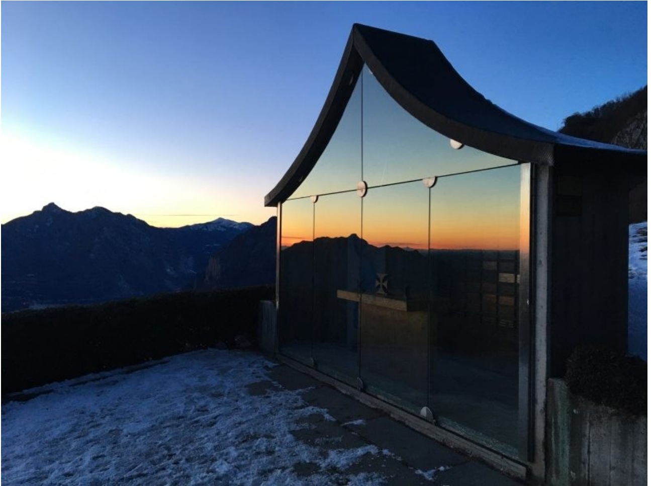
tributo ai caduti