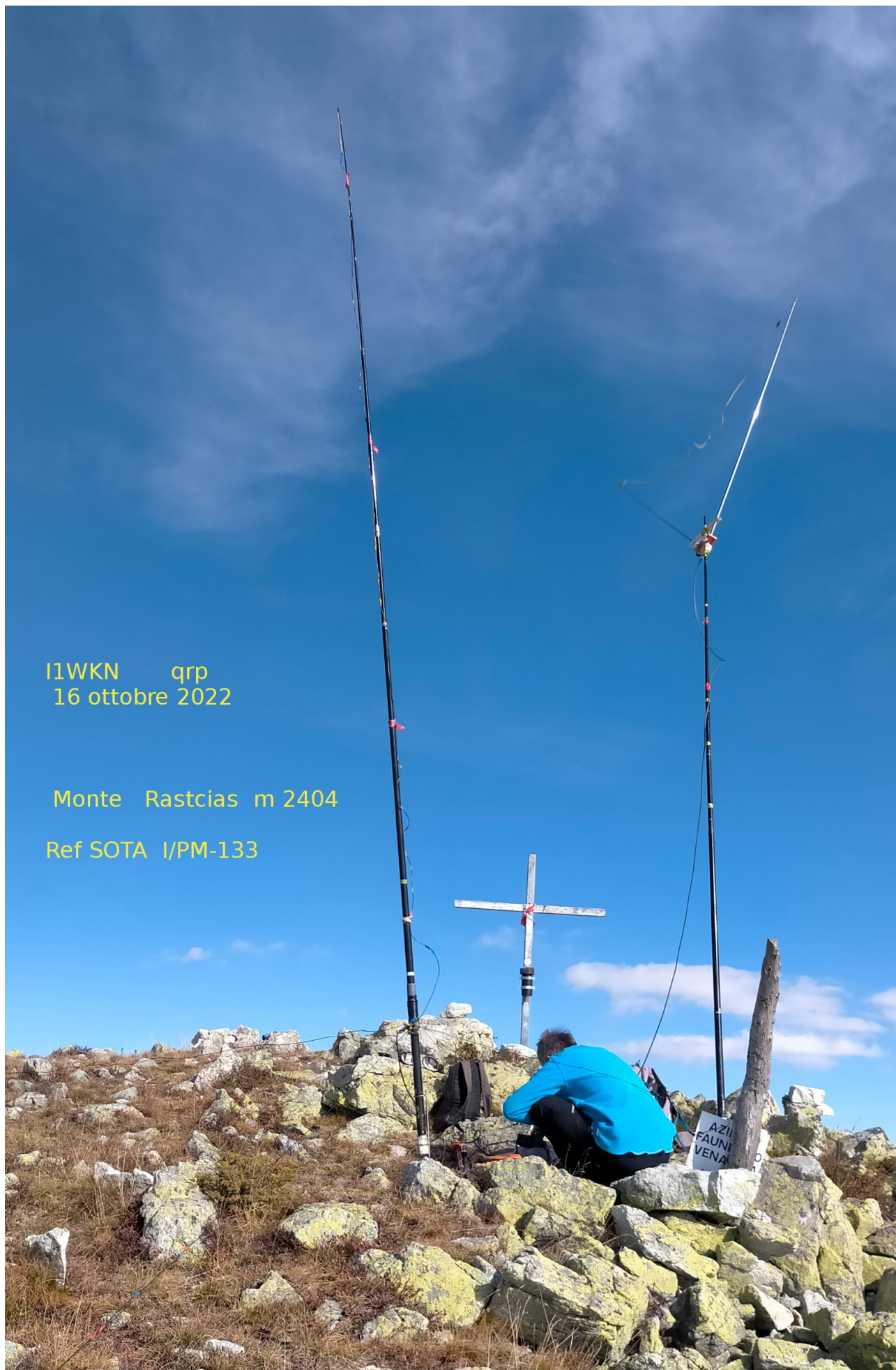
vetta e parco antenne