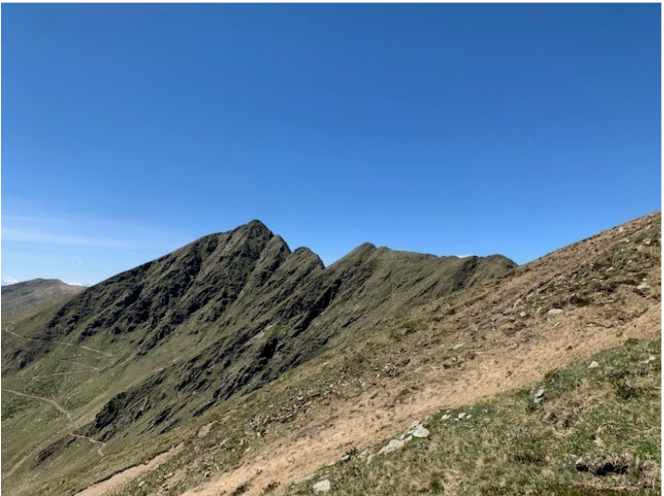
la cima e la cresta