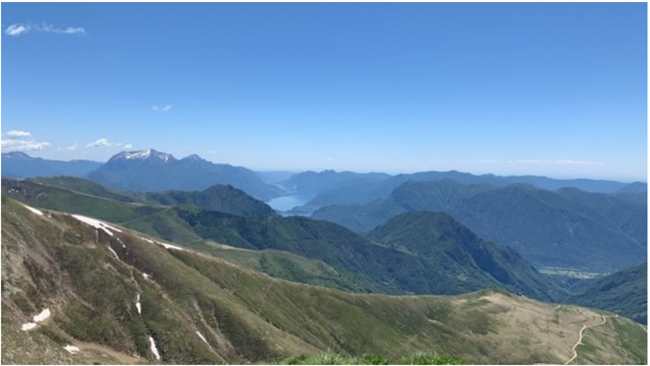
veduta lago di como