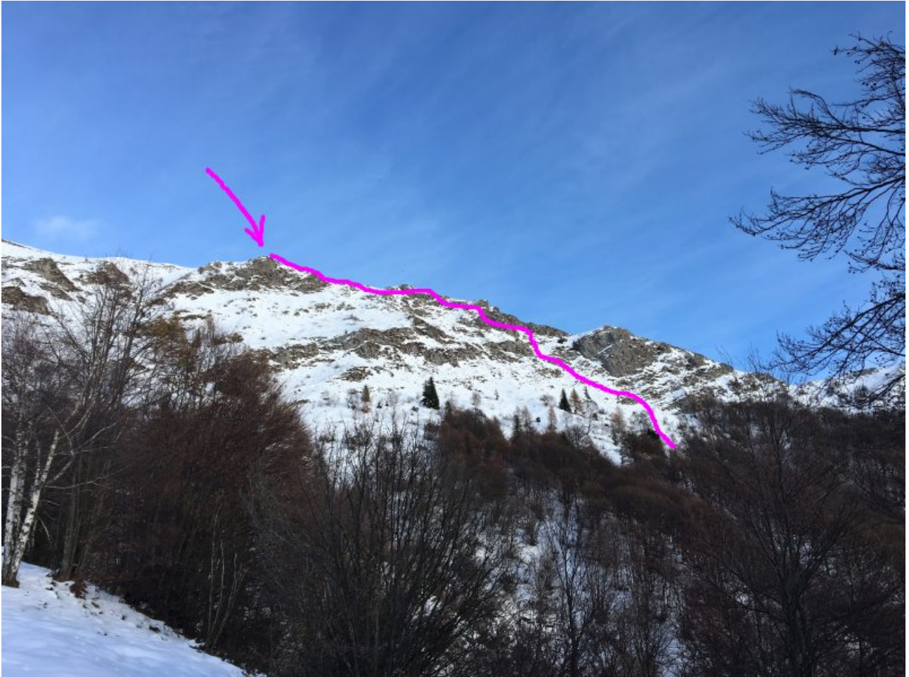
cavalcata di cresta