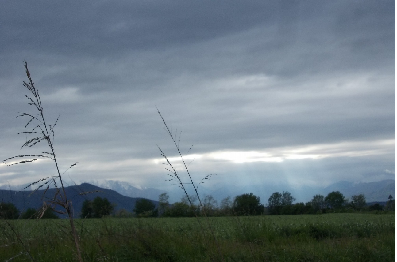
la cima e l'inclemenza del tempo