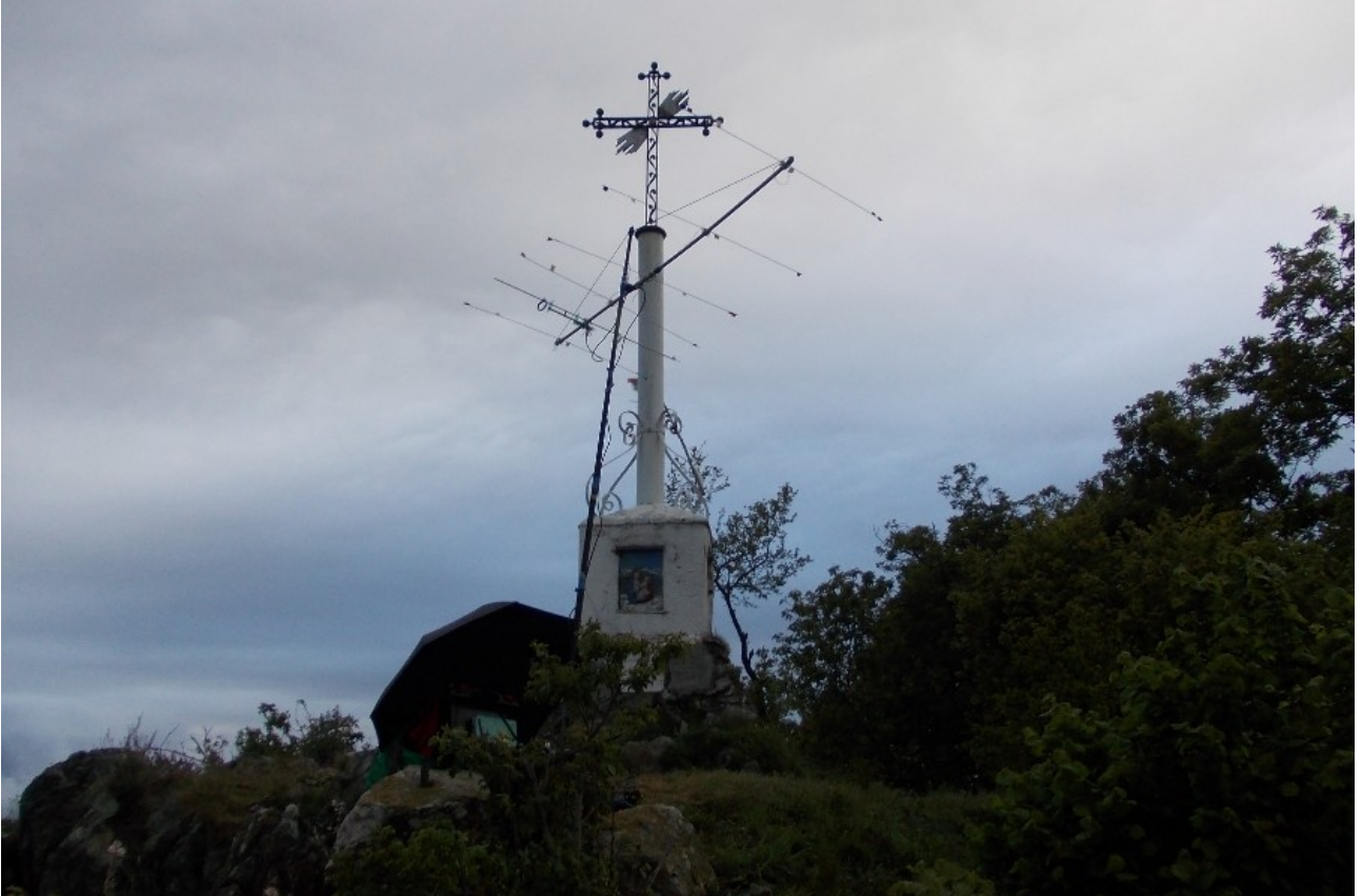
cima e antenna