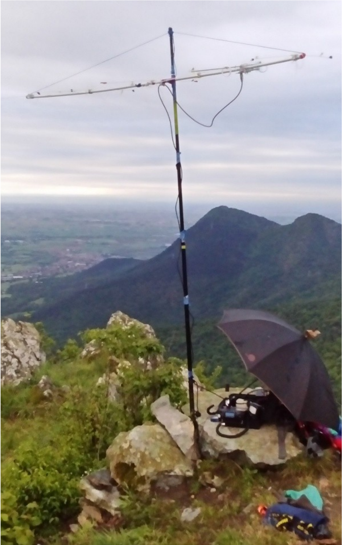
set up & ombrelli