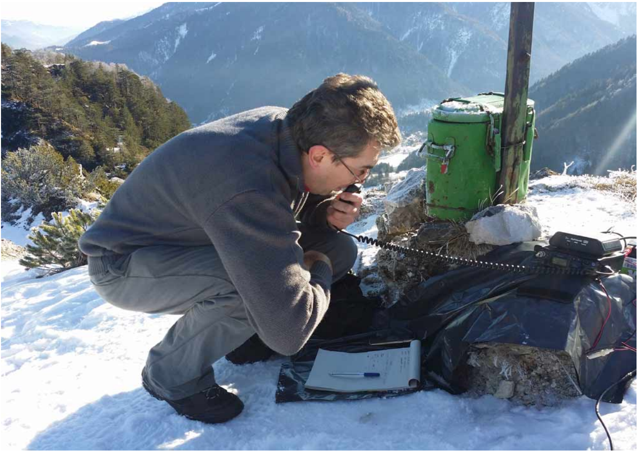
iw3sip al lavoro