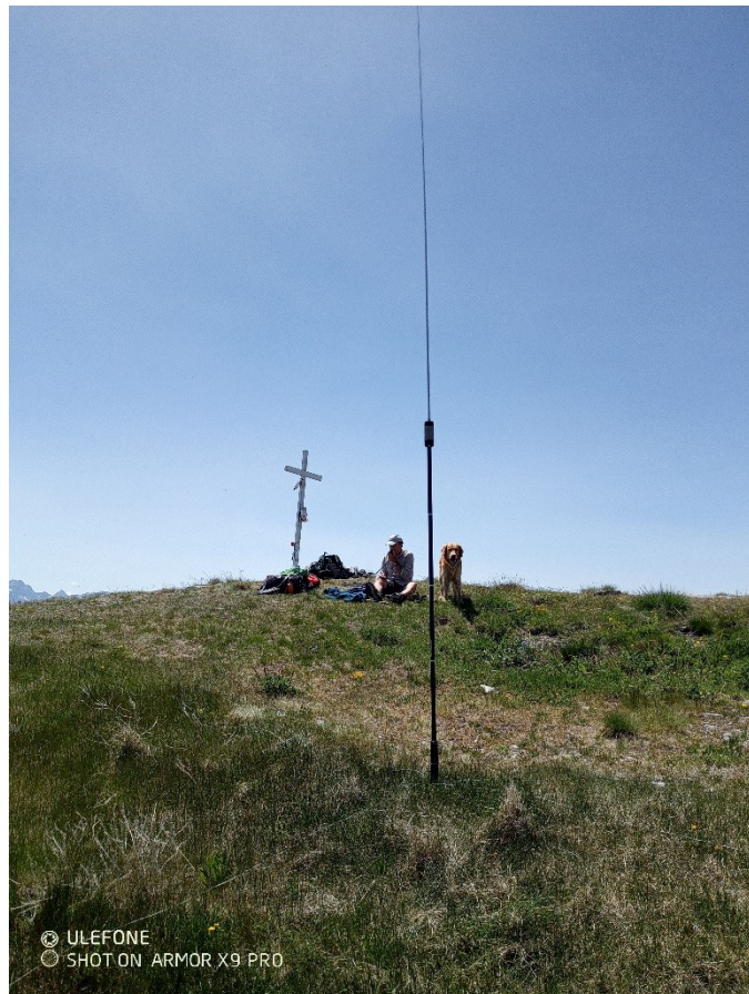
Spedizione al completo