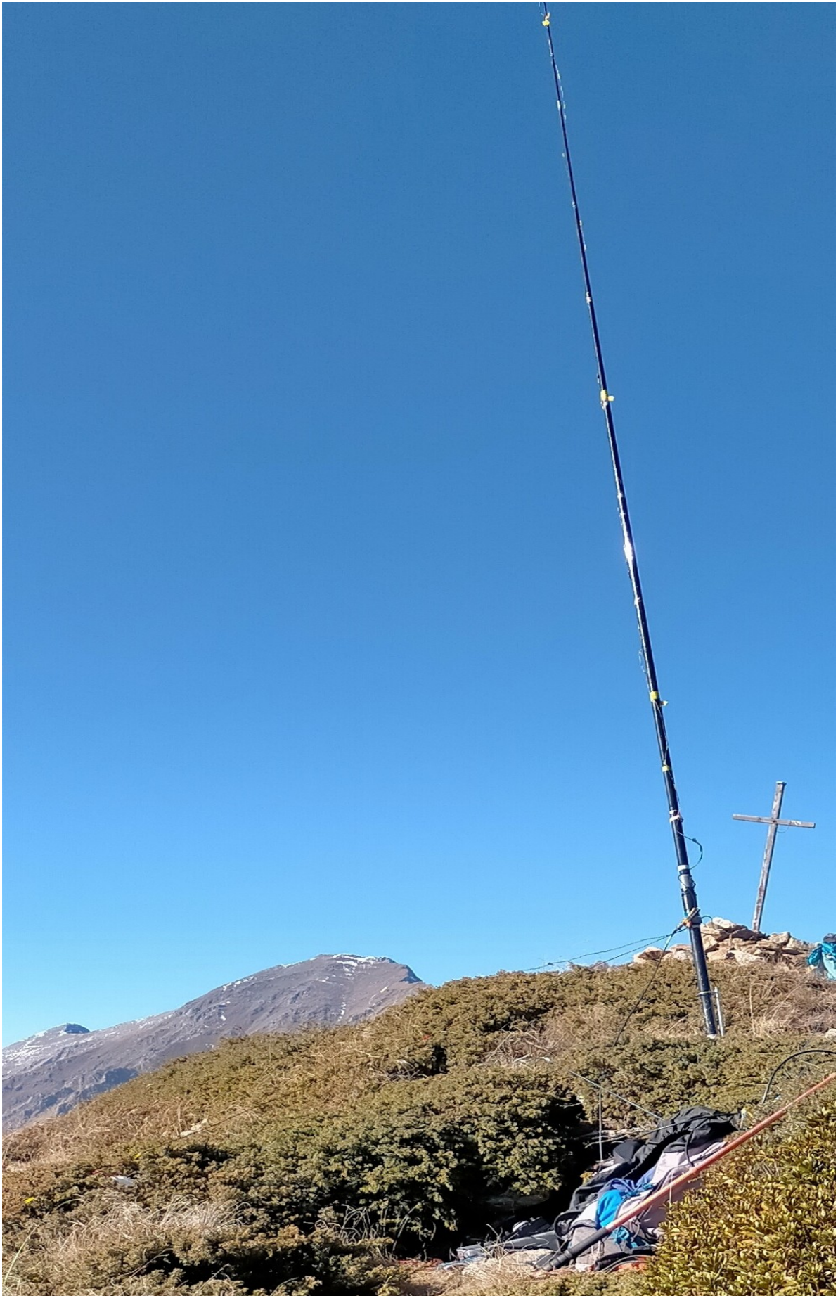
a ntenna e croce di vetta