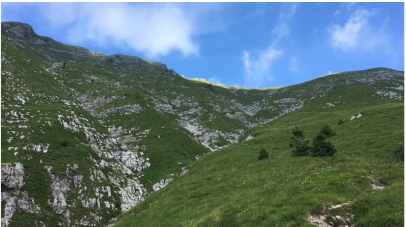
verso il bivacco