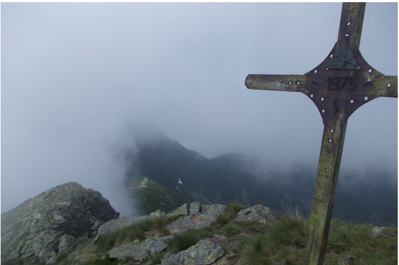
la cresta con croce di vetta