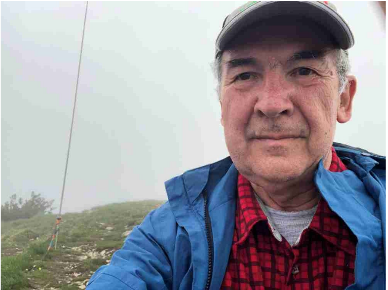
set up ed attivatore