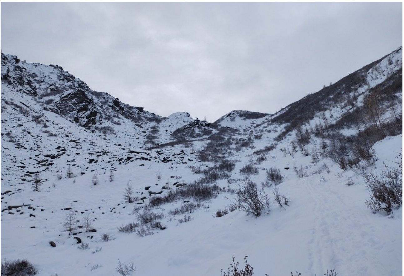
ultimo tratto verso il colle