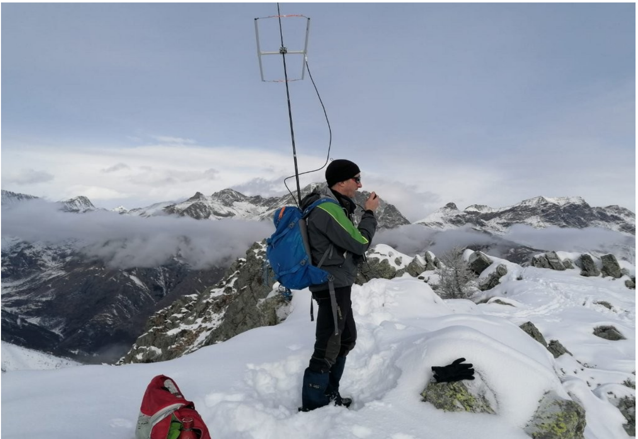
attivatore in vetta