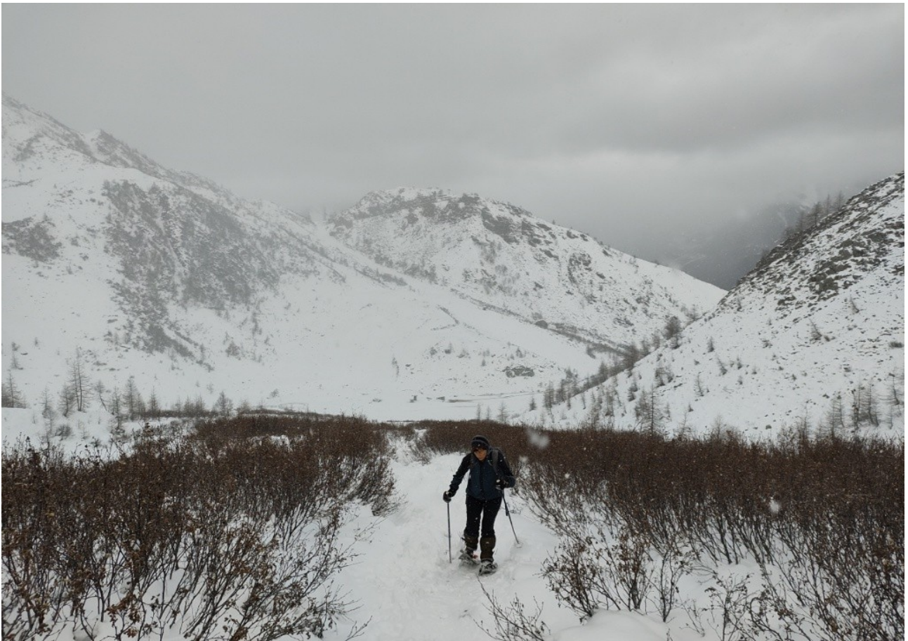
Salendo fra neve e rododendri