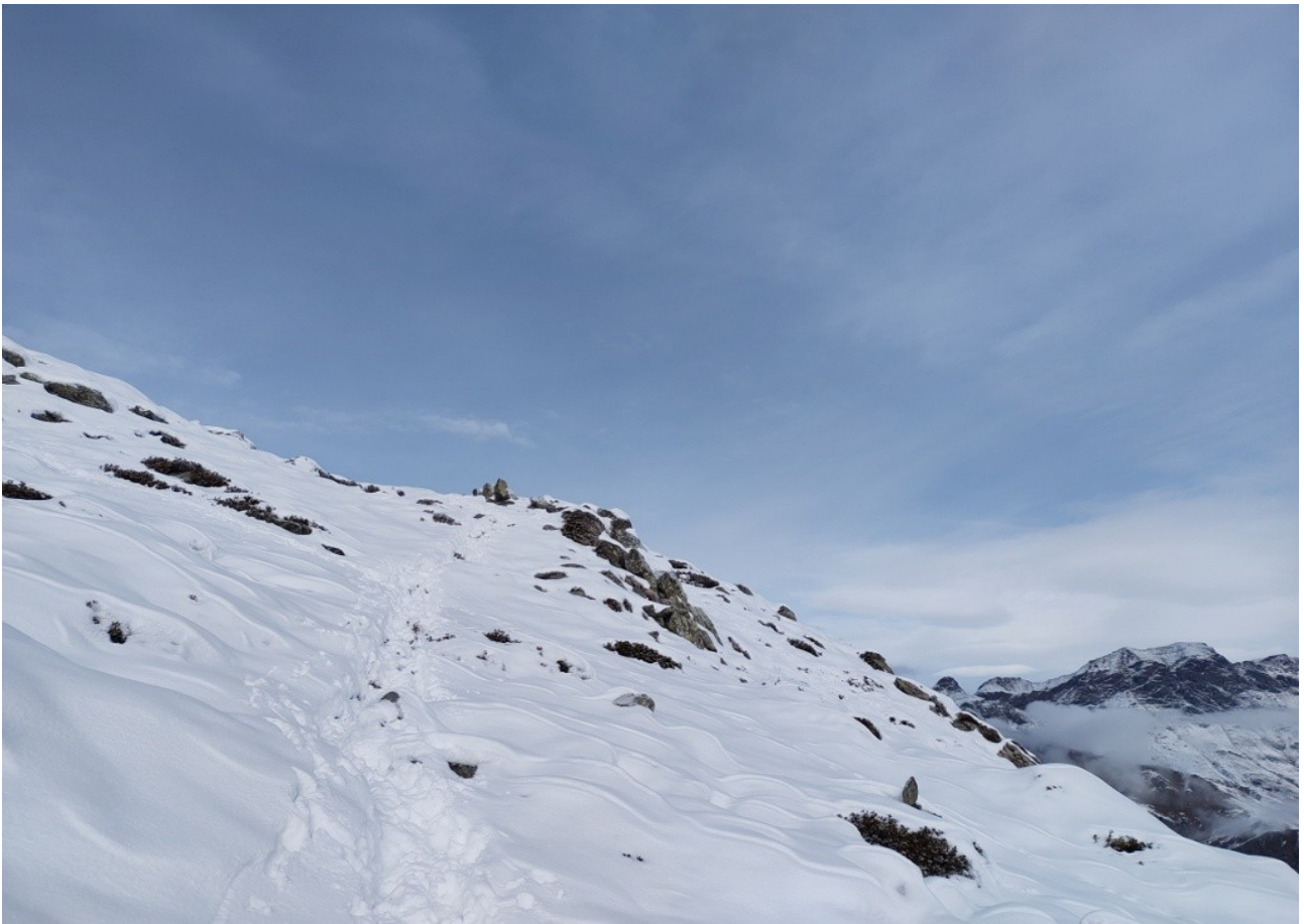
pendio verso la cima