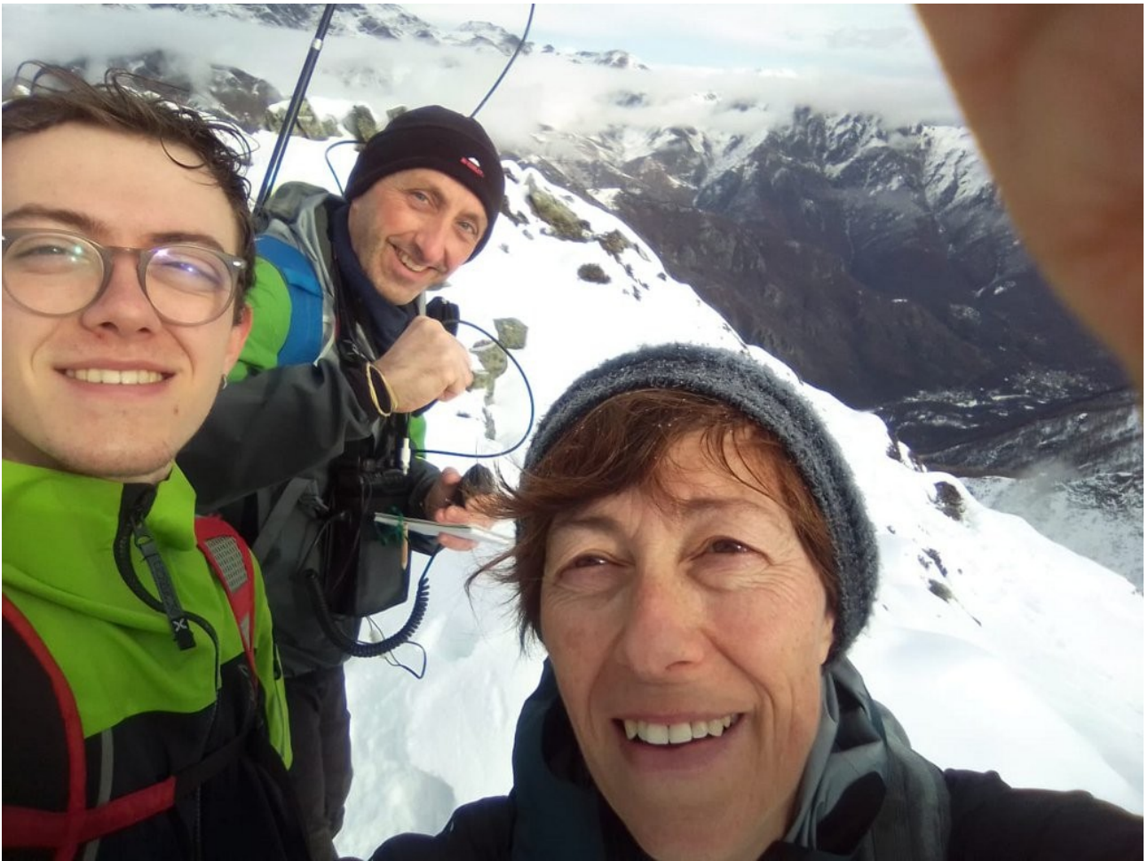
supporto tecnico (la famiglia)