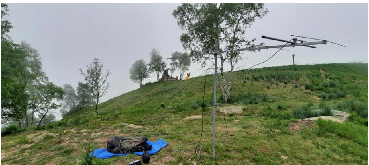
Inizia ad arrivare la nebbia