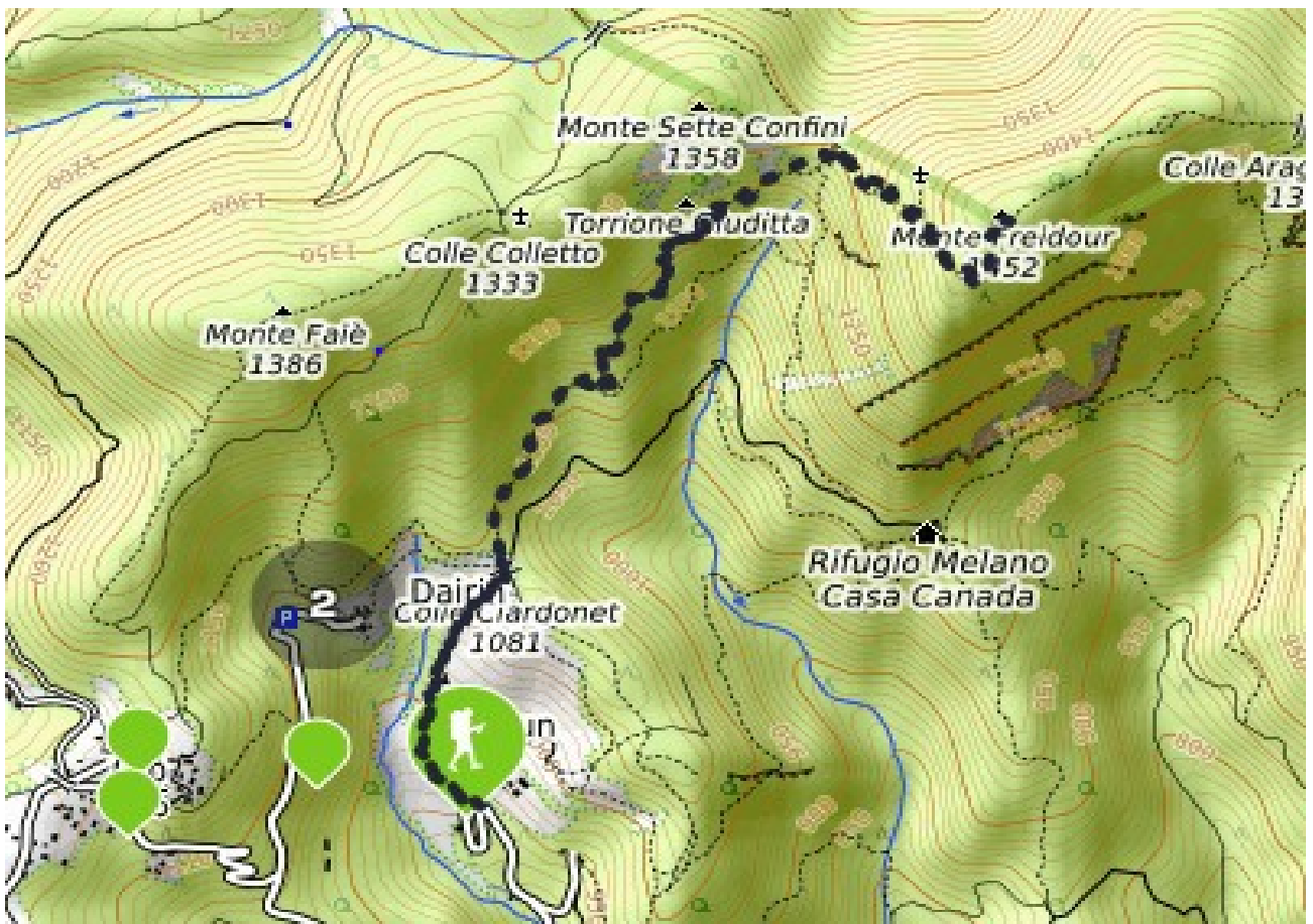
Percorso per arrivare sulla cima. Partendo dalla borgata Dairin. Direzione rif. Melano.