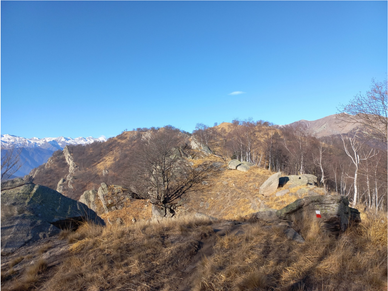
percorso di cresta