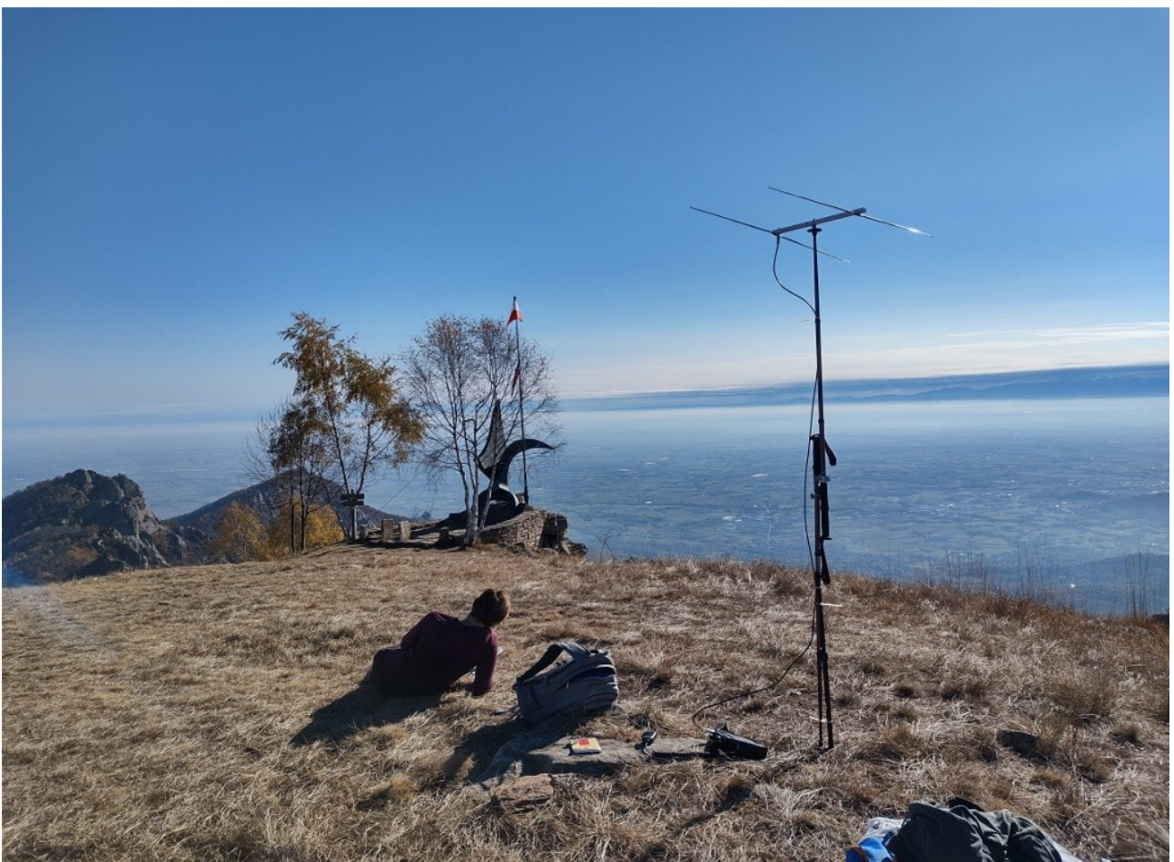
in vetta col monumento ai caduti