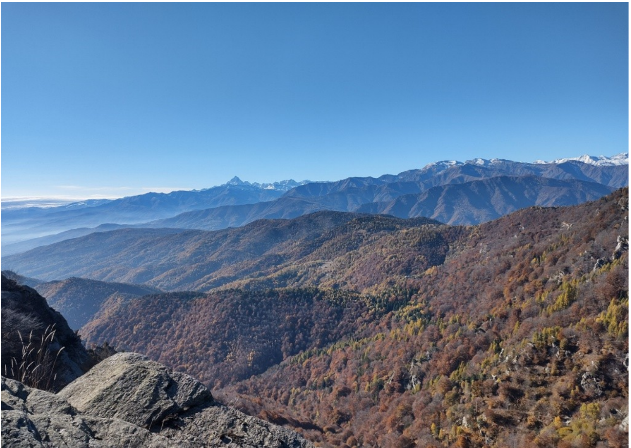
Le splendide faggete del freidour