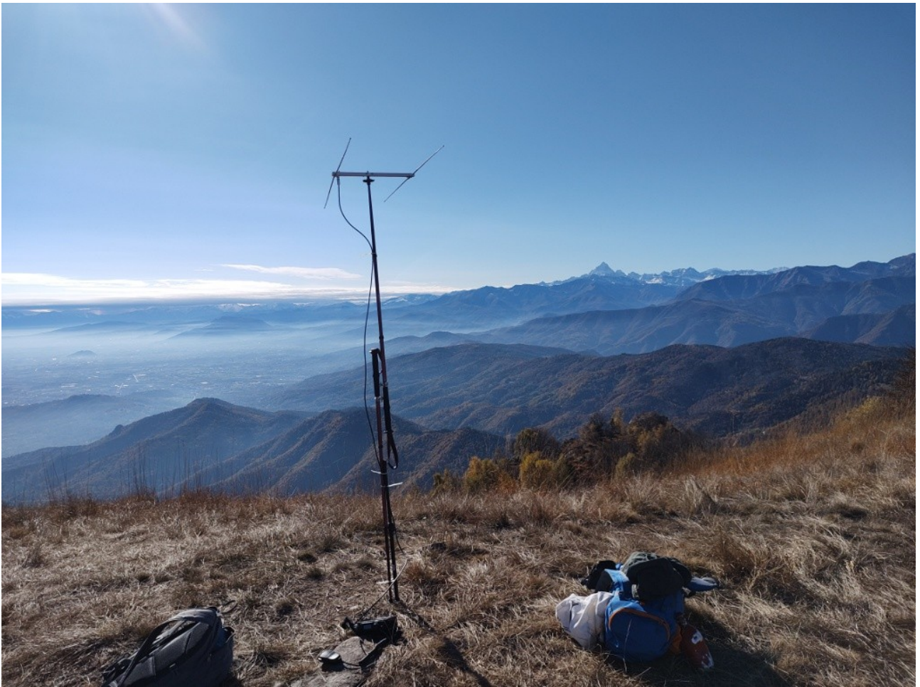
set up con sfondo del monviso