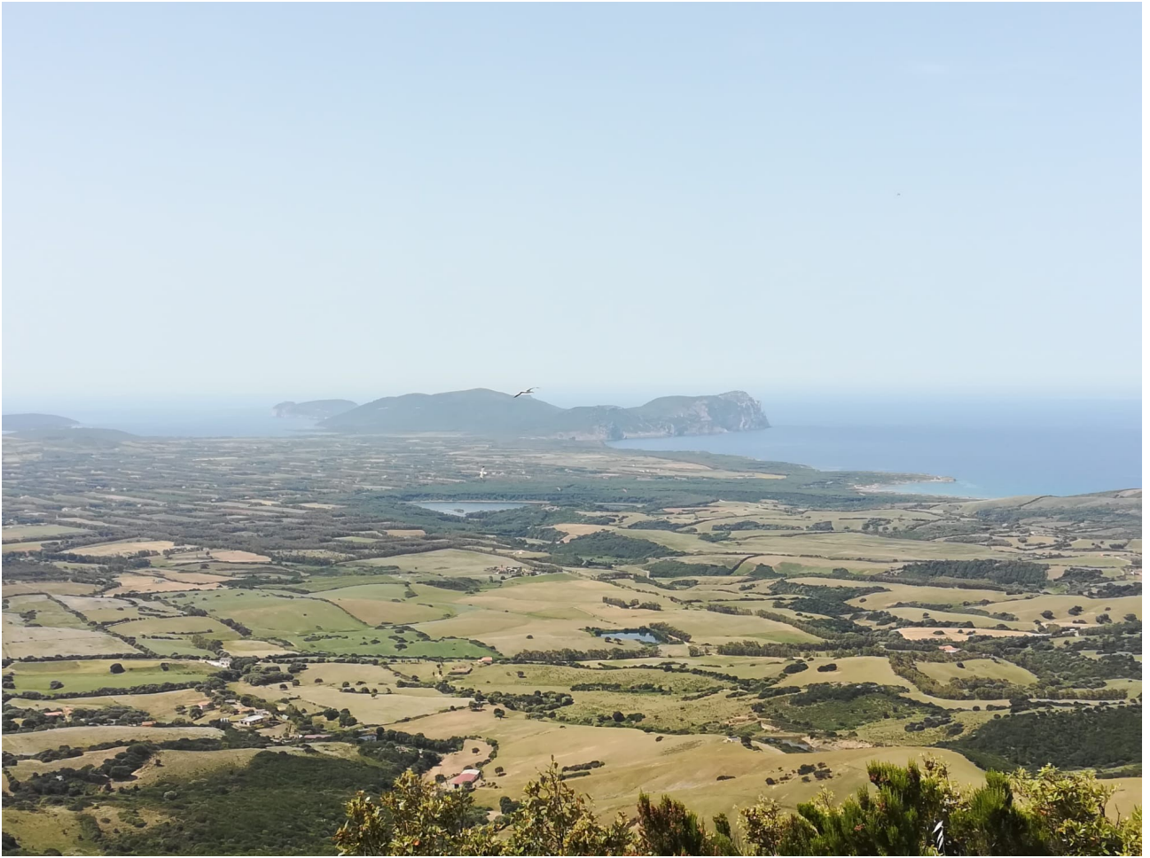
panorama con vista a mare