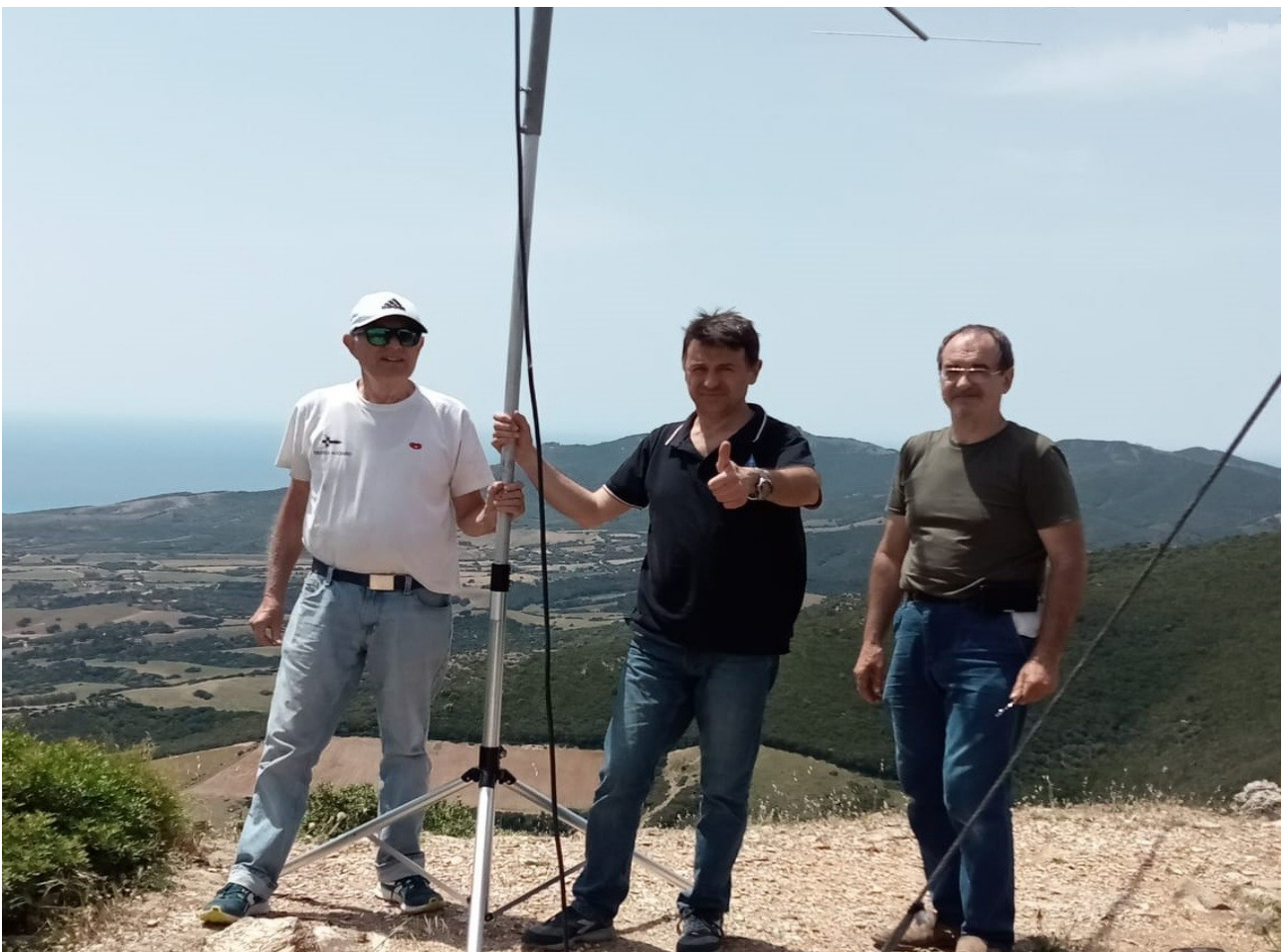
i tre attivatori