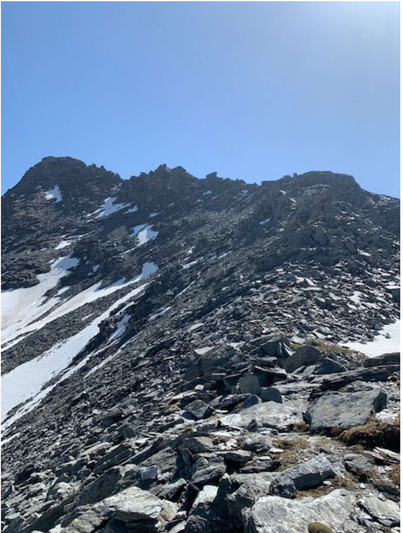
cima e cresta terminale