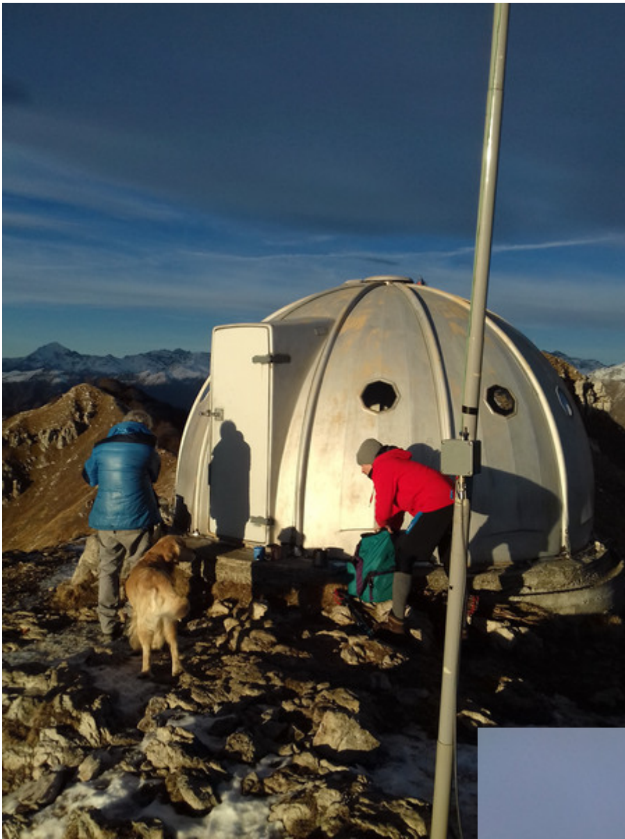
bivacco e set up