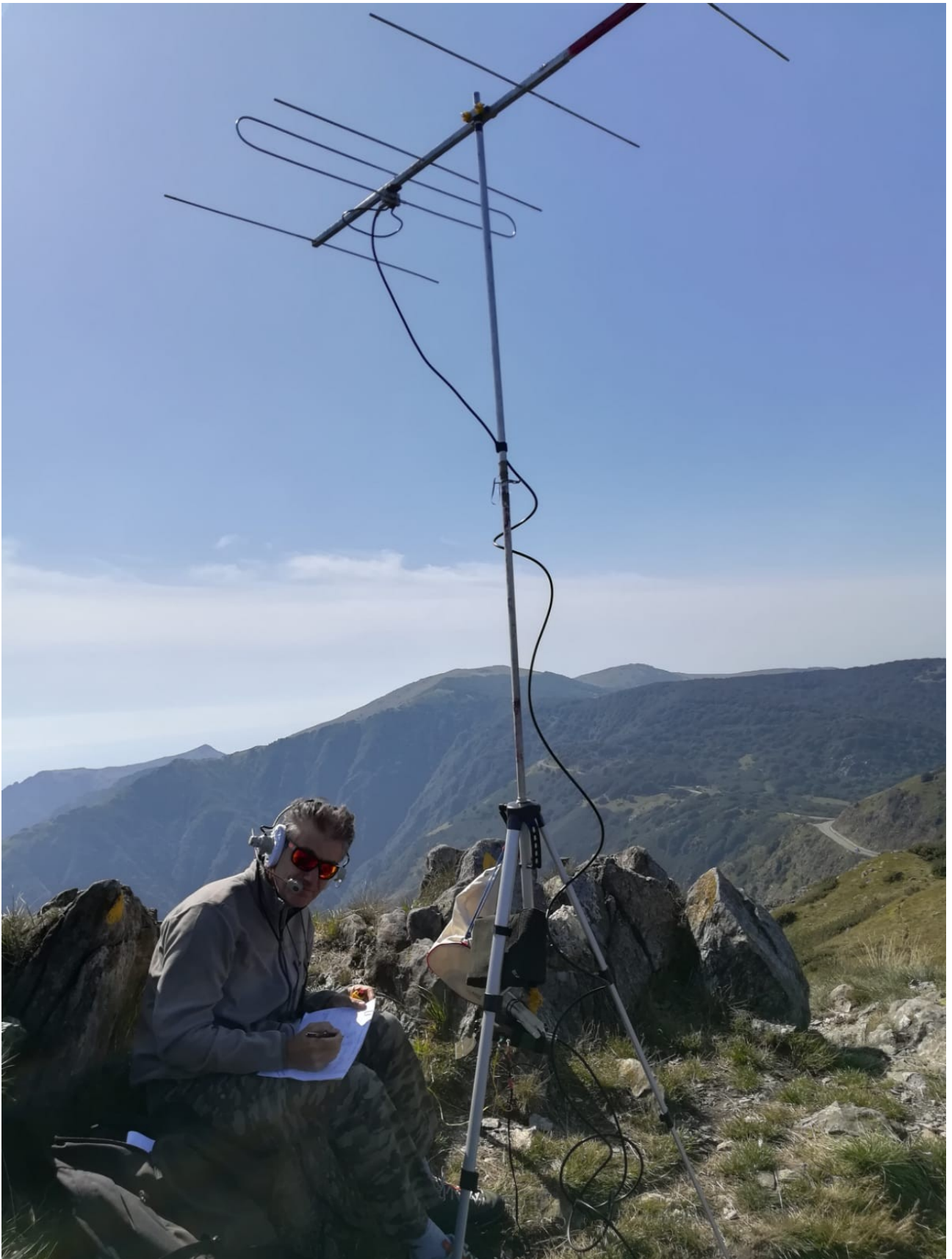
un primo piano