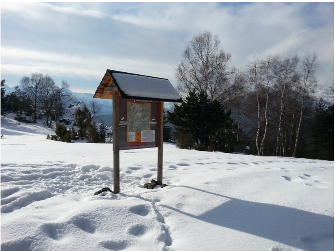
pra du col