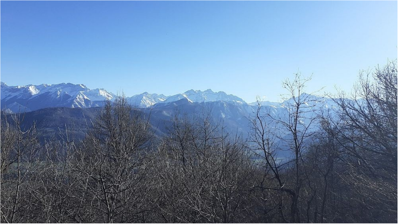
panorama a sud