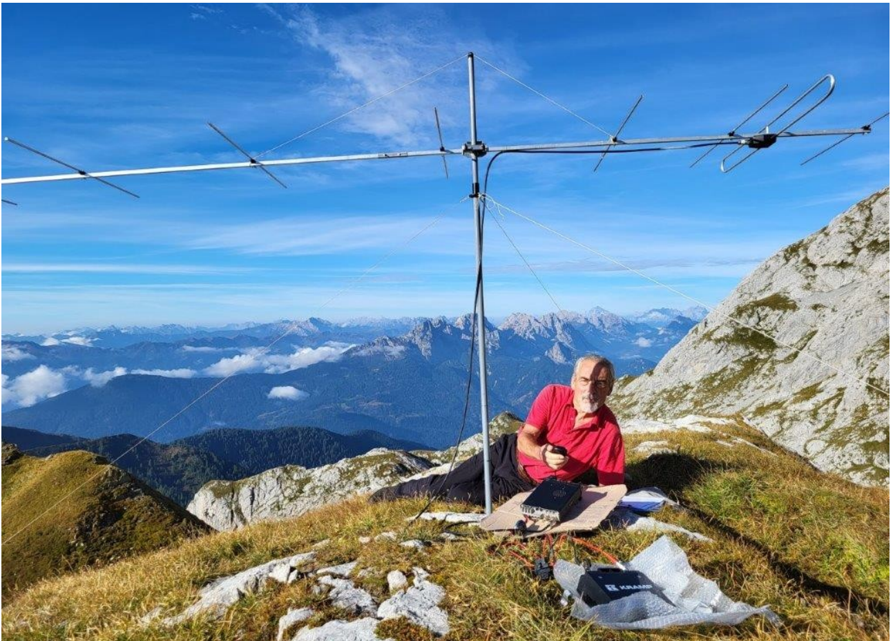
antenna ed attivatore