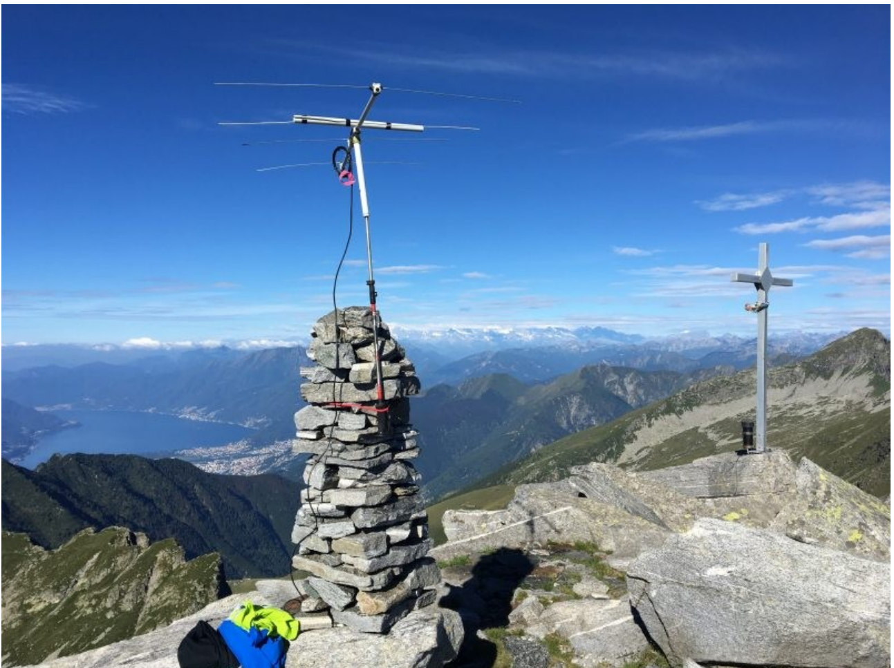
set up cima