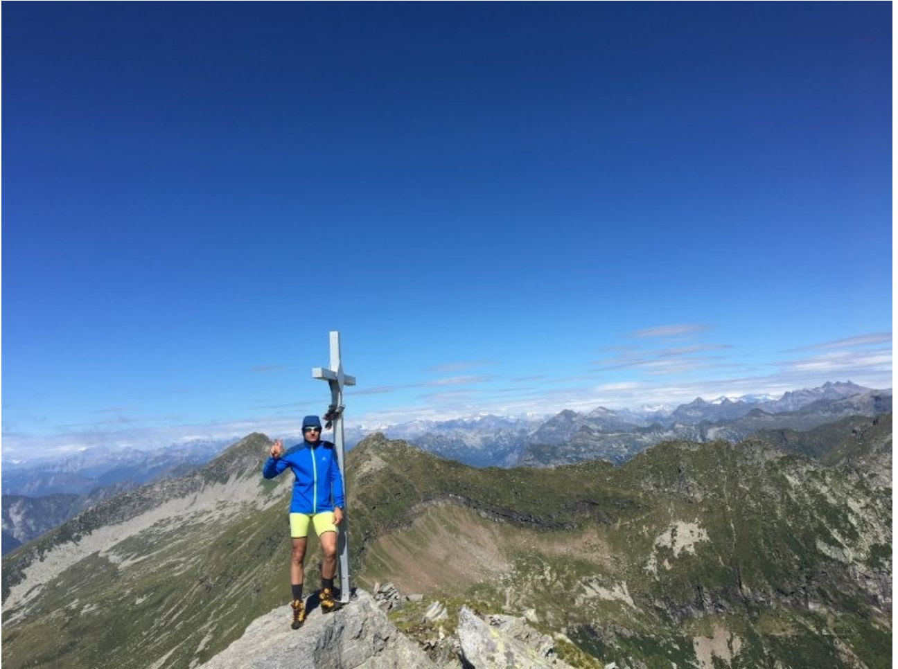
om in vetta