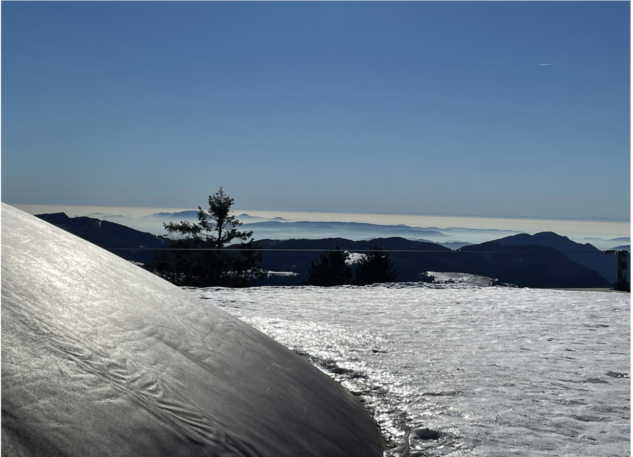
vista verso la pianura