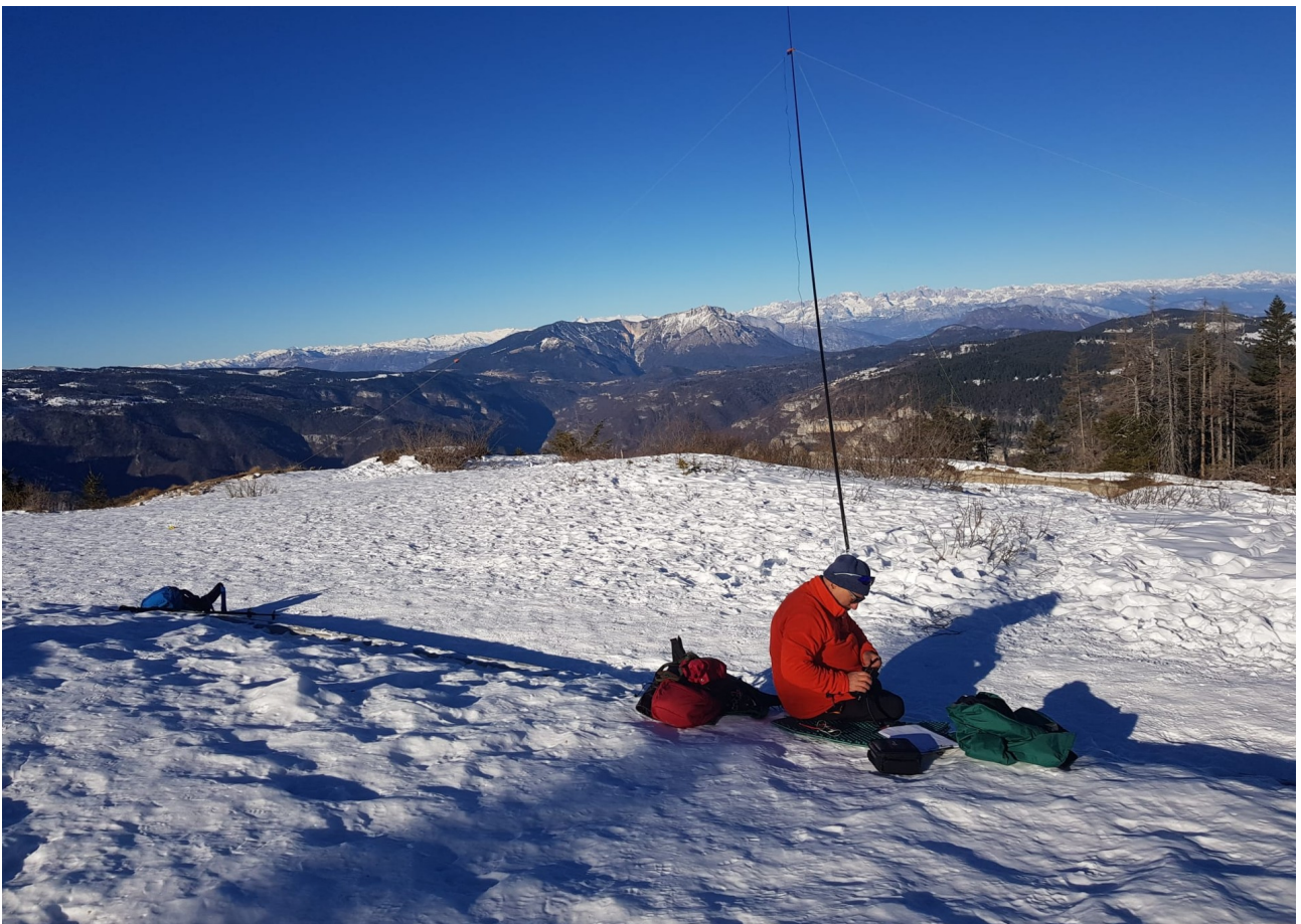
vista verso l'adamello