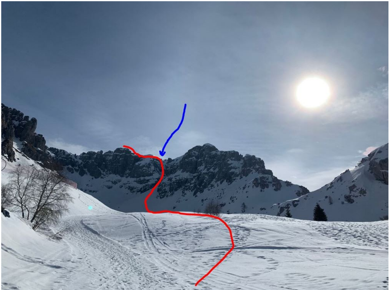
il percorso di salita