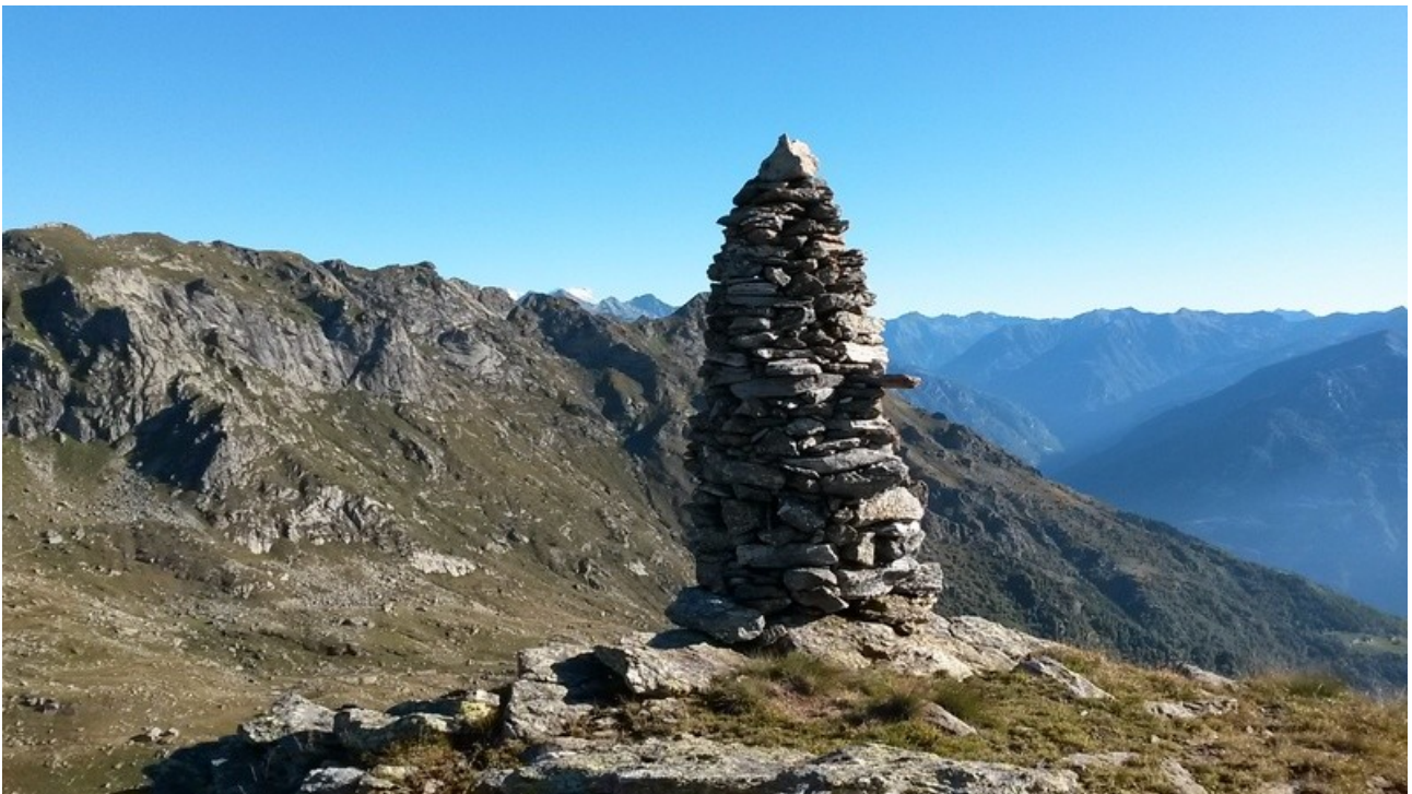
qui la pietra non manca