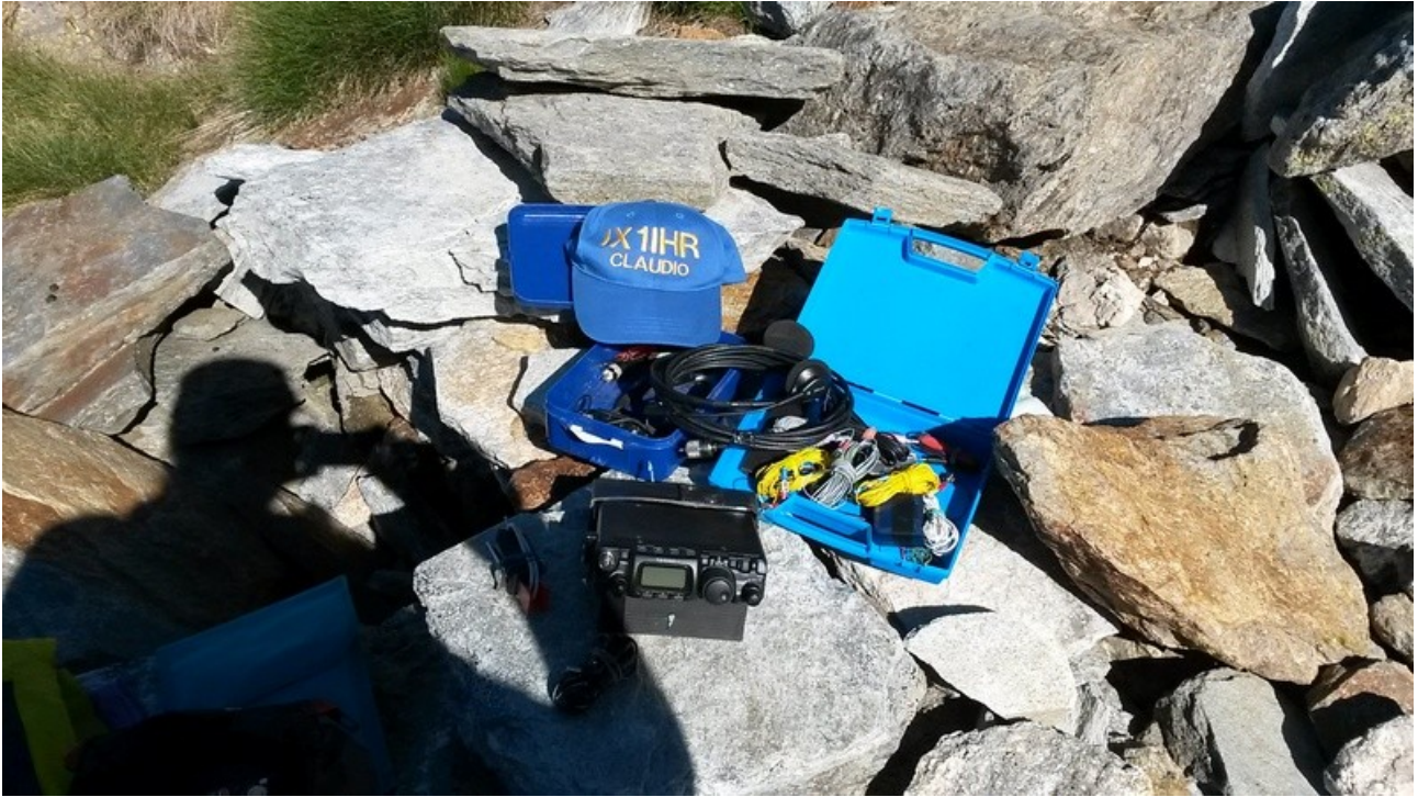
questa la mia attrezzatura