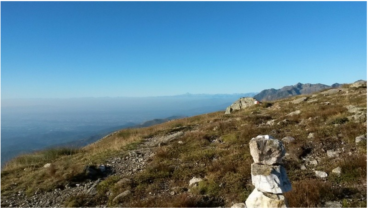
primo colle con vista monviso