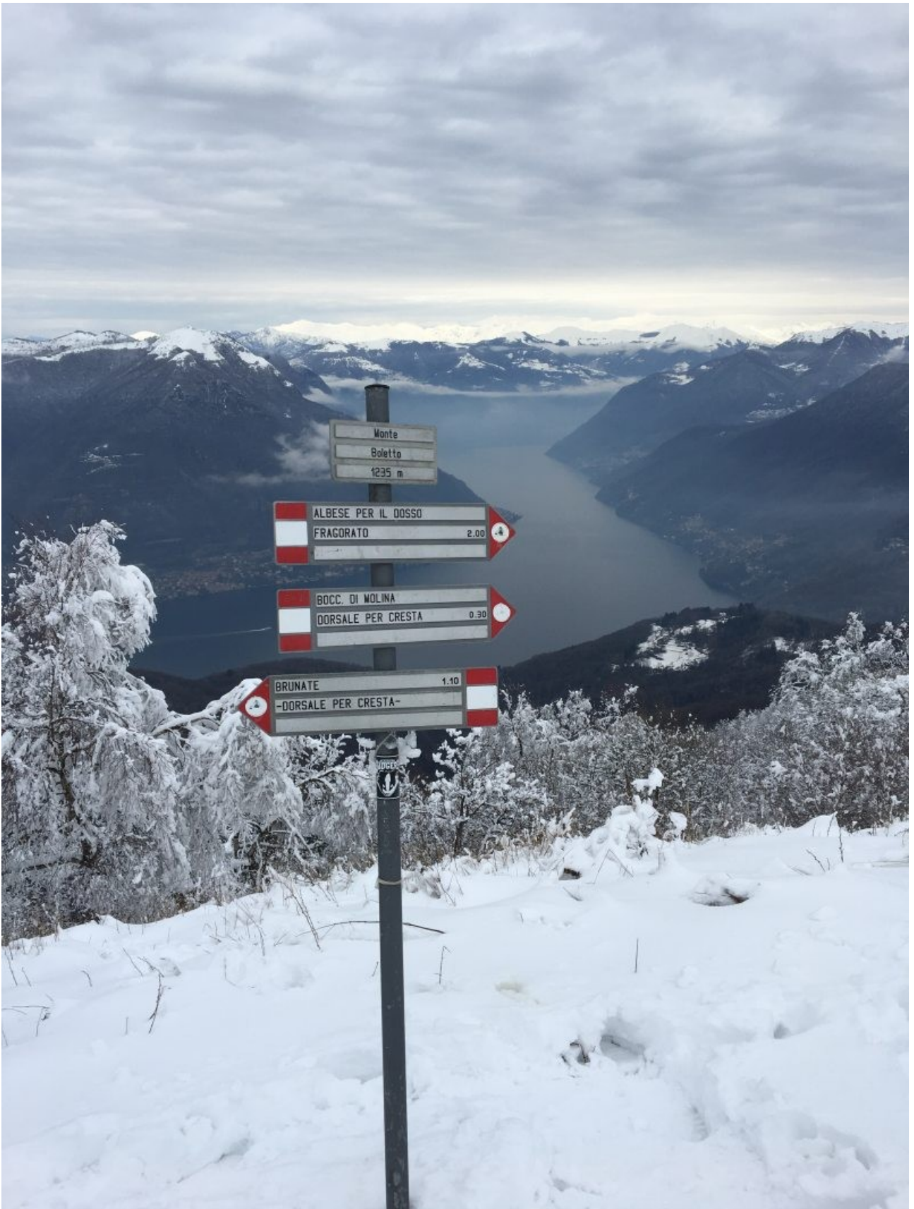
lago di como