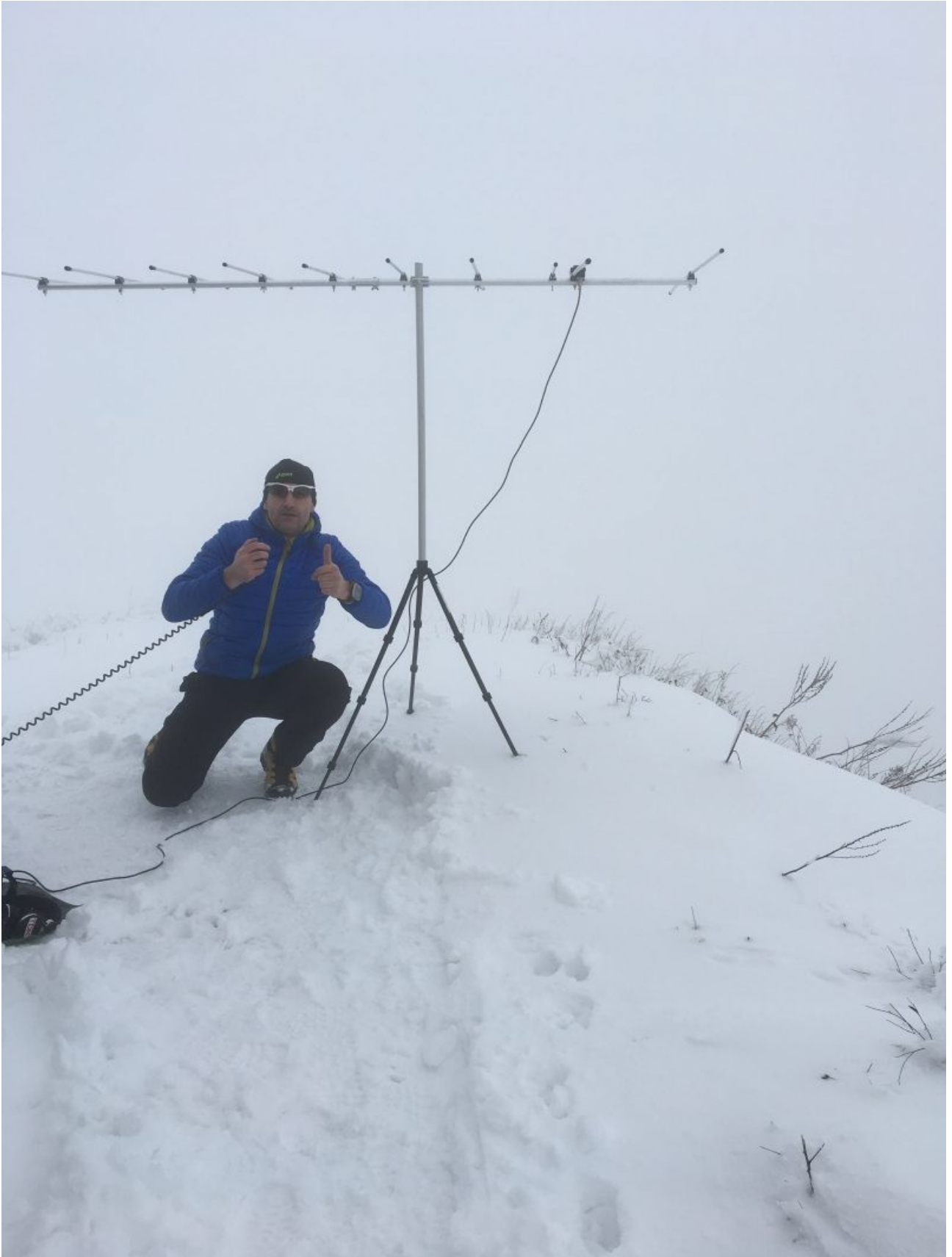
OM on air