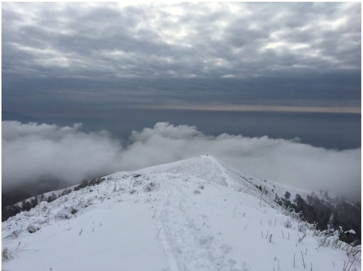
la pianura padana