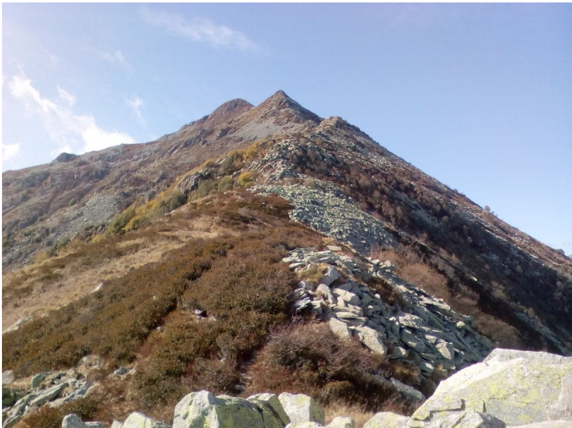
bisalta dalla cresta NE