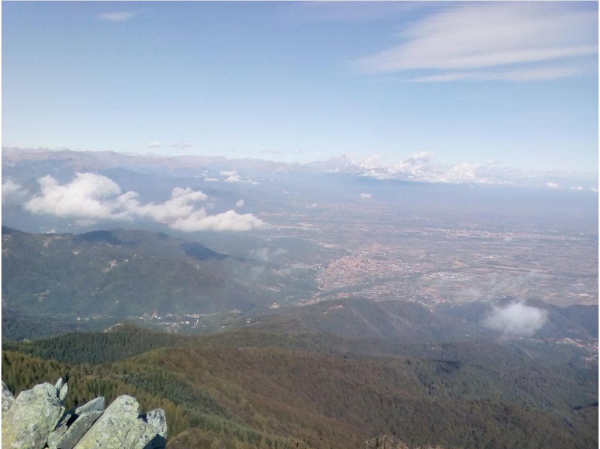
la il monviso