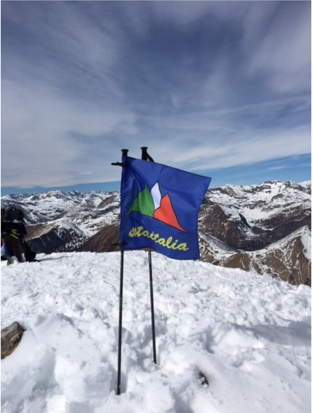
la bandiera sotitalia