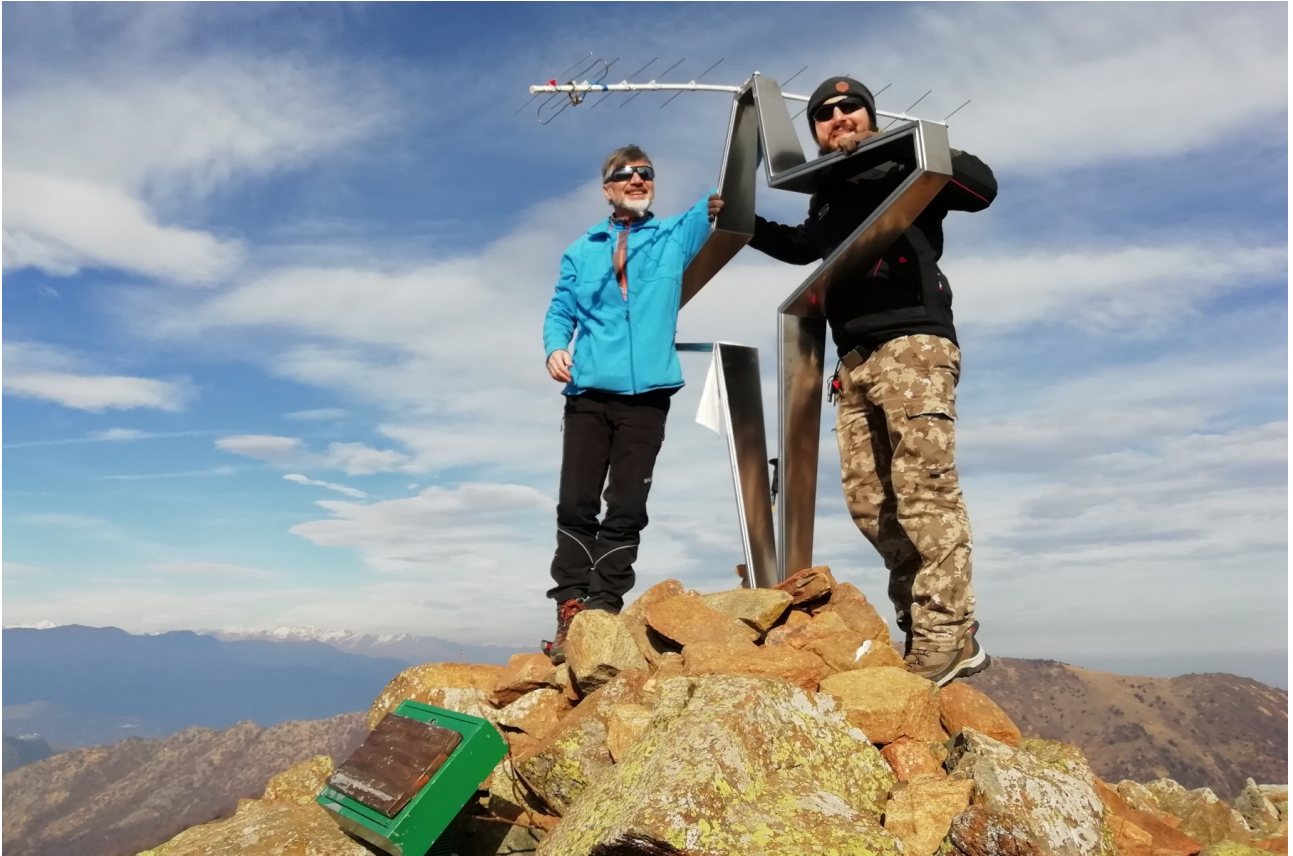
gli attivatori in vetta