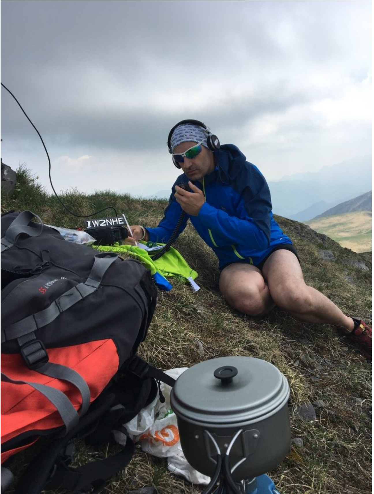
OM on air