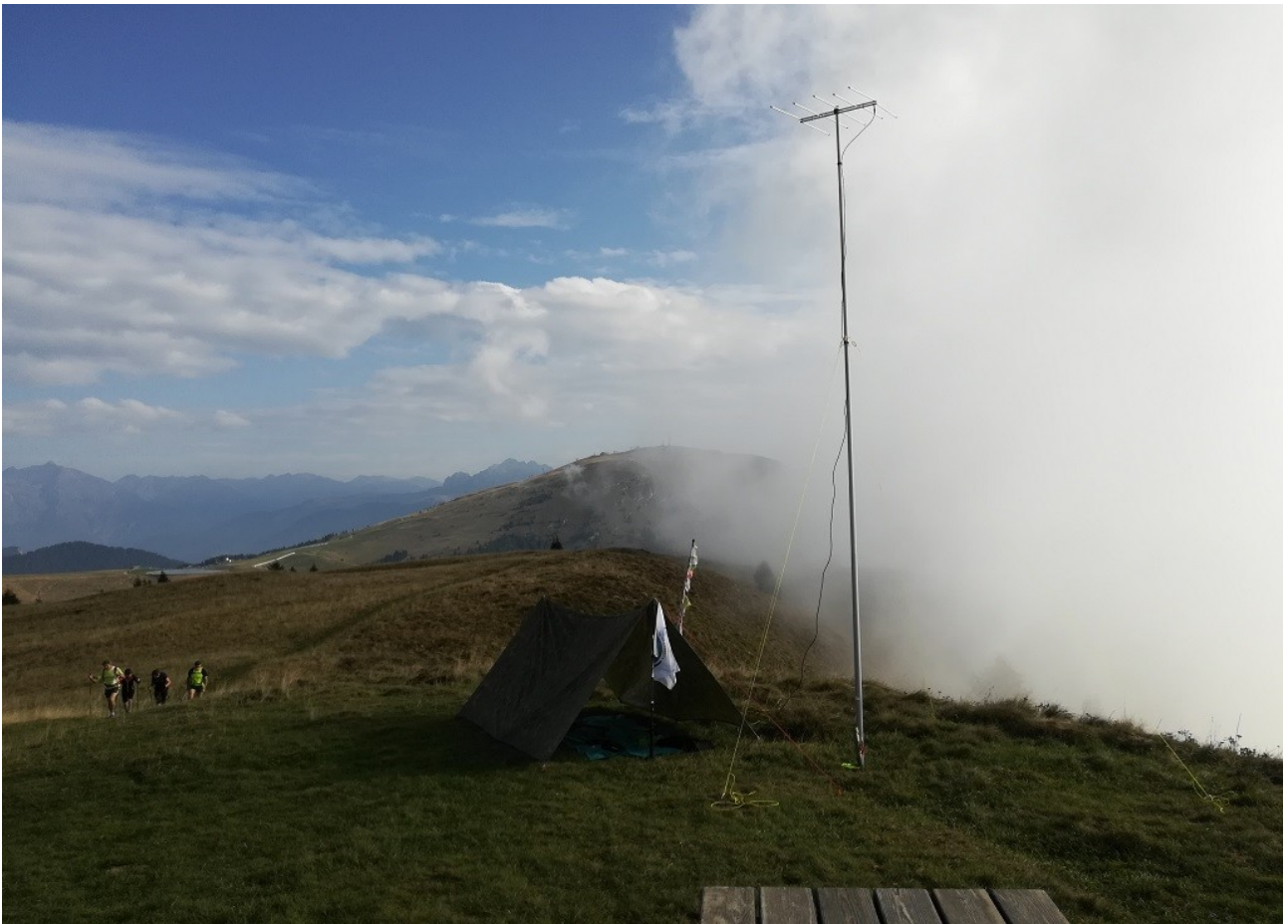
quello che si dice tempo variabile