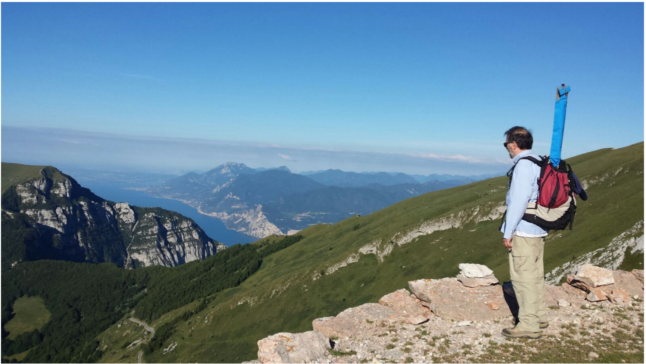
contemplando il lago di garda